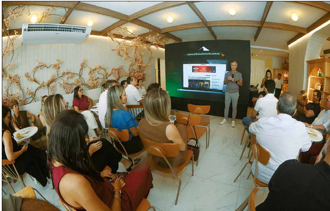
Lançamento reuniu empresários, publicitários e representantes do Governo nesta terça-feira

O mercado publicitário também compartilha dessa visão. Na visão do presidente do Sindicato das Agências de Propaganda do