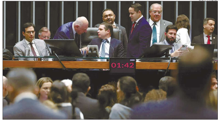
A data da votação do texto, prevista para o dia 26 de maio na Comissão, segue mantida

após reunião do relator, na noite da terça-feira (19), com o presidente da Câmara, Hugo Motta (Republicanos-PB), e o líder do governo na Casa, deputado Paulo Pimenta (PT-RS).