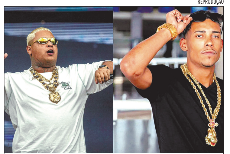
MC Ryan SP e Poze do Rodo são investigados pela Federal