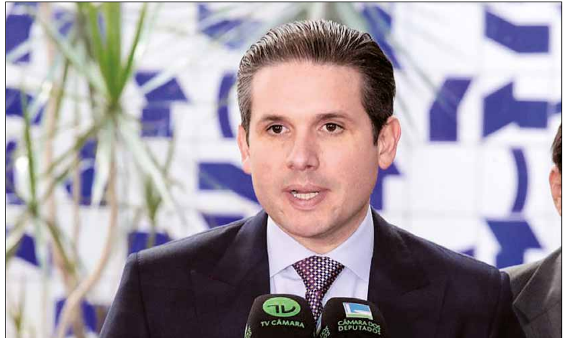
Presidente Hugo Motta procura destravar a pauta de votações da Câmara dos Deputados

Hoje, Alcolumbre tem segurança de temas de interesse do governo, como é o caso da PEC 6x1, sequer despachada pela presidência do Senado para a Comissão de Constituição e Justiça (CCJ) do Senado.