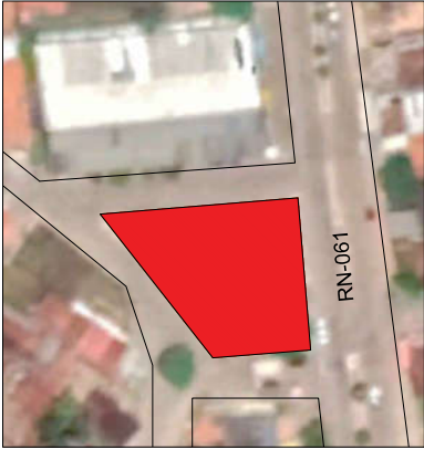
PLANTA DE SITUAÇÃO