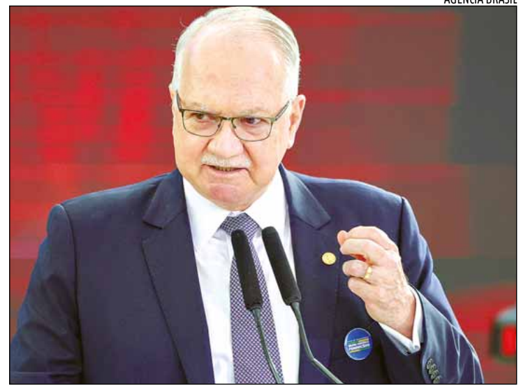
Ministro Fachin recebeu demanda do Conselho Federal da OAB

A OAB conclui o ofício solicitando uma audiência com Fachin para expor seus argumentos sobre o tema, pede que "sejam adotadas providências voltadas à conclusão dos chamados inquéritos de natureza perpétua" e que "não haja a instauração de novos procedimentos com essa mesma conformação expansiva e indefinida".