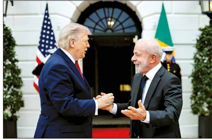
Lula na chegada para o encontro com Trump, na Casa Branca

O presidente afirmou que o Brasil quer ampliar o conhecimento sobre o próprio território e agregar valor à produção nacional, sem assumir apenas o papel de exportador de matérias-primas. “A gente conhece 30% do nosso território, agora temos