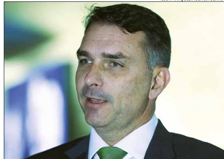
Flávio falou por meio de nota, de vídeo e se reuniu com aliados

Nas redes sociais, Flávio disse também ter procurado outros investidores e que o filme está pronto. "Não promovi encontros privados fora da agenda. Não intermediei negócios com o governo. Não recebi dinheiro ou qualquer vantagem. Isso é muito diferente das relações espúrias do governo Lula e seus representantes com Vorcaro. Por isso, reitero, CPI do MASTER