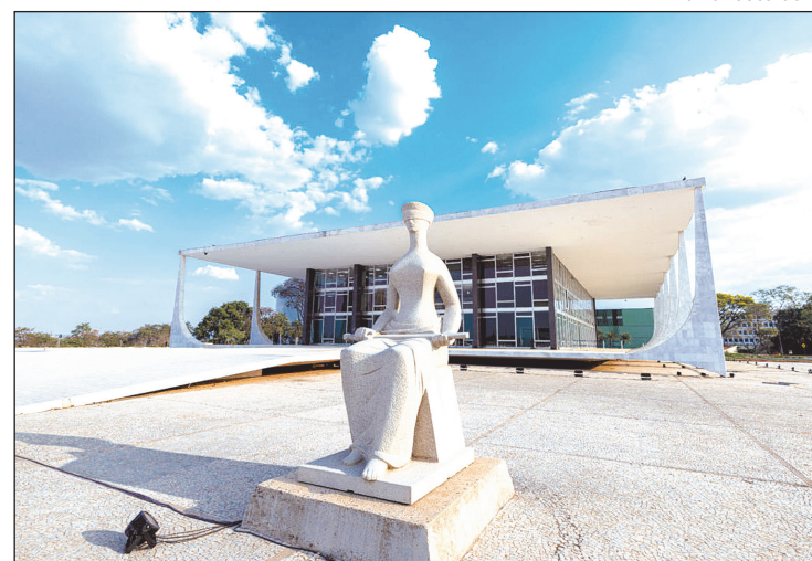
Associação pede um novo teto para o funcionalismo, de R$ 71 mil

Um dos principais pleitos é que o STF altere a decisão que impôs um limite de 35% aos