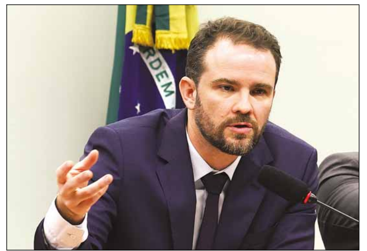
Durigan sobre EUA: "Não cabe ao Brasil lugar de vassalagem"

De acordo com o ministro, caberia ao governo norte-americano ter entrado em contato com o Bra-