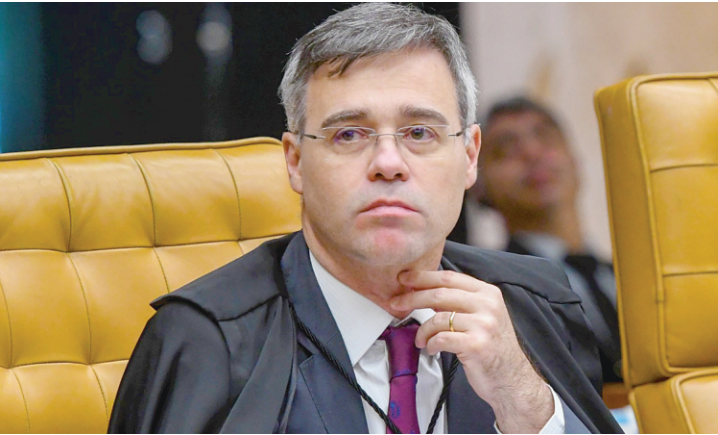
André Mendonça é responsável por julgar caso de banco no Supremo

SISTEMA FINANCEIRO Deputados e senadores da oposição acionaram o Supremo Tribunal Federal (STF) e pediram ao ministro André Mendonça que determine ao Congresso a instalação de uma Comissão Parlamentar de Inquérito para investigar supostas irregularidades no Banco Master. Mendonça é o relator do inquérito sobre a instituição financeira. A solicitação é centrada no pedido de uma comissão mista, unindo integrantes da Câmara e do Senado. Já há número mínimo de assinaturas para o funcionamento, mas o presidente do Senado, Davi Alcolumbre (União-AP), a quem caberia ler o requerimento de instalação, não dá