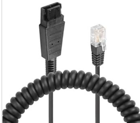
Esquema de pinagem conector QD (Quick Disconnect) para RJ9