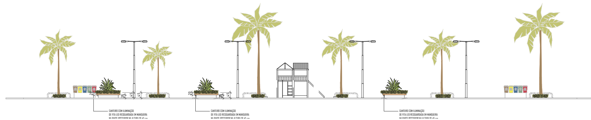
3 VISTA LATERAL ESCALA: 1/200 OBS.: CONFERIR COTAS NA OBRA