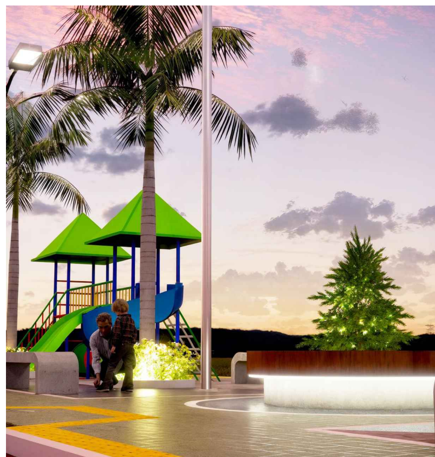
2 IMAGEM ESCALA: SEM OBS.: CONFERIR COTAS NA OBRA