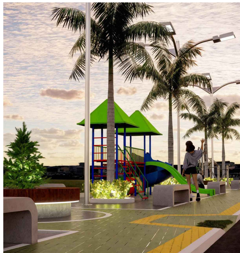
3 IMAGEM ESCALA: SEM OBS.: CONFERIR COTAS NA OBRA