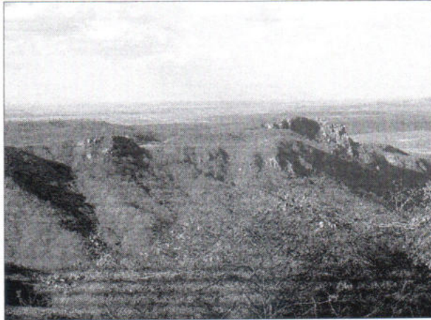
Refúgio, que se estende por três municípios da Caatinga, busca proteger espécies ameaçadas