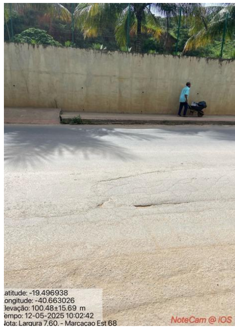
Figura 08 – Registro de patologias na Rod. Gether Lopes de Farias