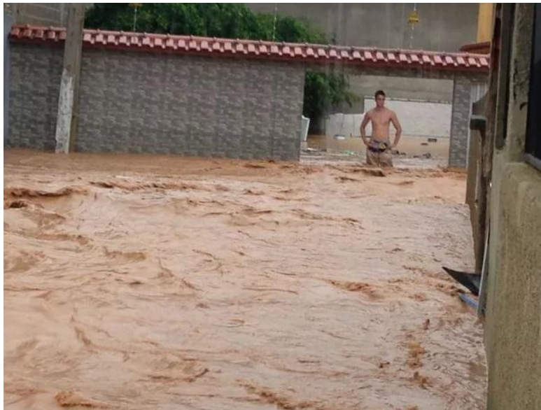
Chuva forte provocou alagamento no bairro Carlos Germano Naumann em Colatina