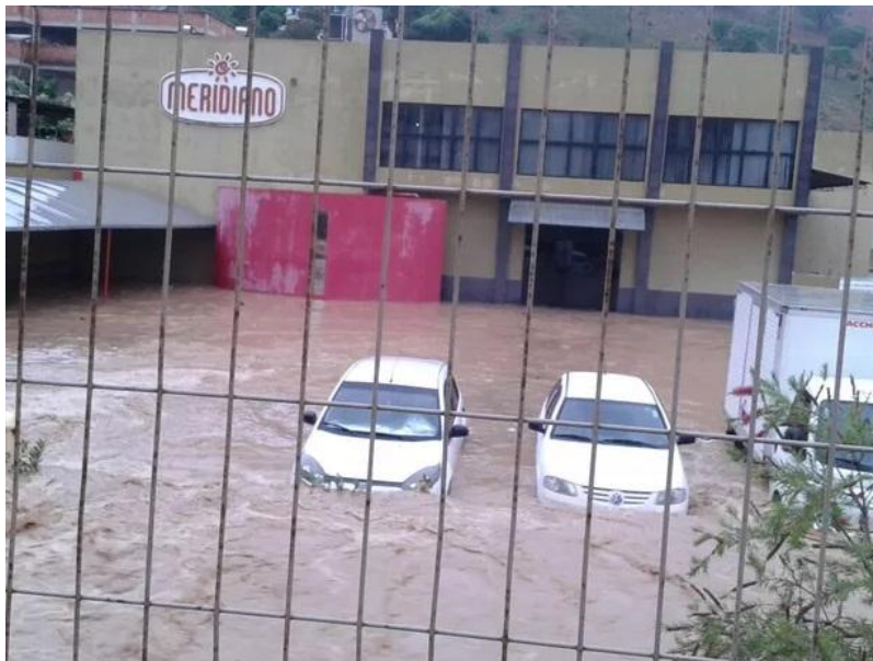
Estacionamento de empresa ficou completamente alagado em Colatina