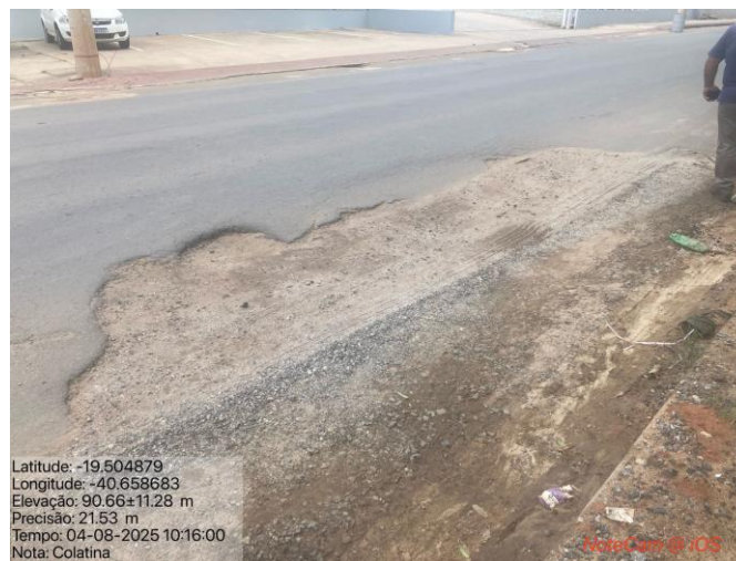
Figura 07 – Registro de patologias na Rod. Gether Lopes de Farias

Tal situação pode ser verificada nas figuras a seguir: