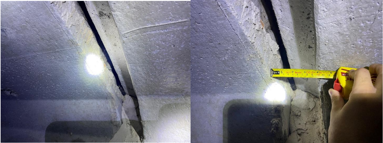
Figura 05: Locais com aberturas de tamanho inadmissível de acordo com as boas práticas de engenharia.