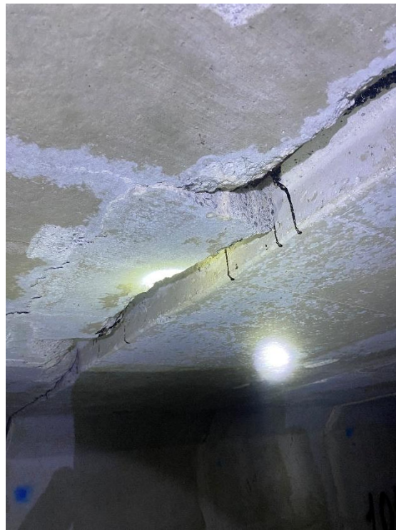
Figura 06: Reparos de forma desconforme com o determinado pela fiscalização.

No mês de dezembro/2025, a contratada, contrariando as determinações e notificações da fiscalização, desmobilizou a frente de serviço responsável pelos reparos, e continuou realizando pequenos serviços de calçada e no parque linear, porém com produtividade muito aquém da necessária para a conclusão do contrato, com base no cronograma físico-