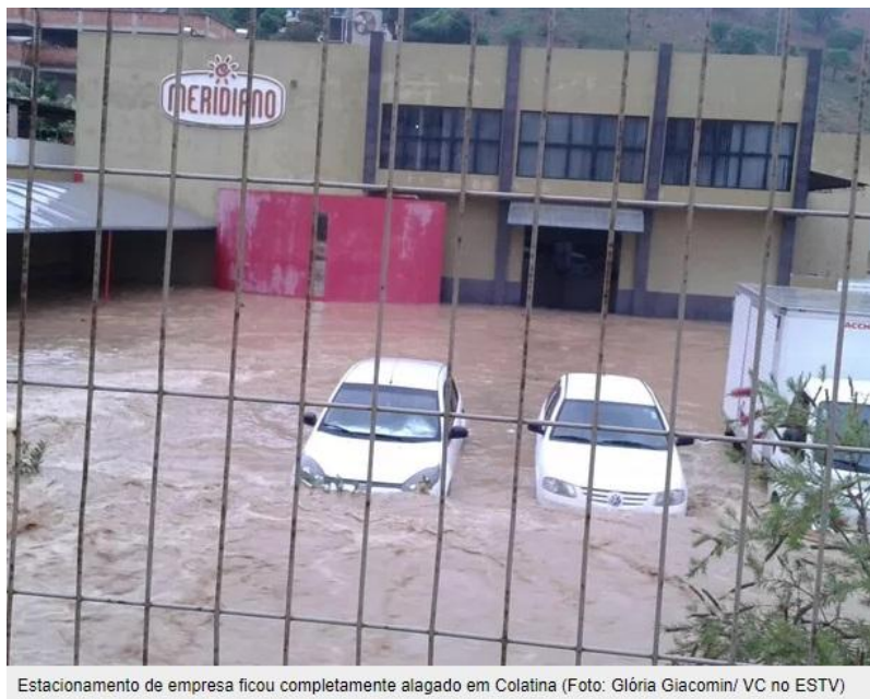
Estacionamento de empresa ficou completamente alagado em Colatina (Foto: Glória Giacomin/ VC no ESTV)

Figura 03 – Registro da enchente ocorrida em 2016, no bairro Carlos Germano Nauman Disponível em < www.g1.globo.com/espírito-santo >