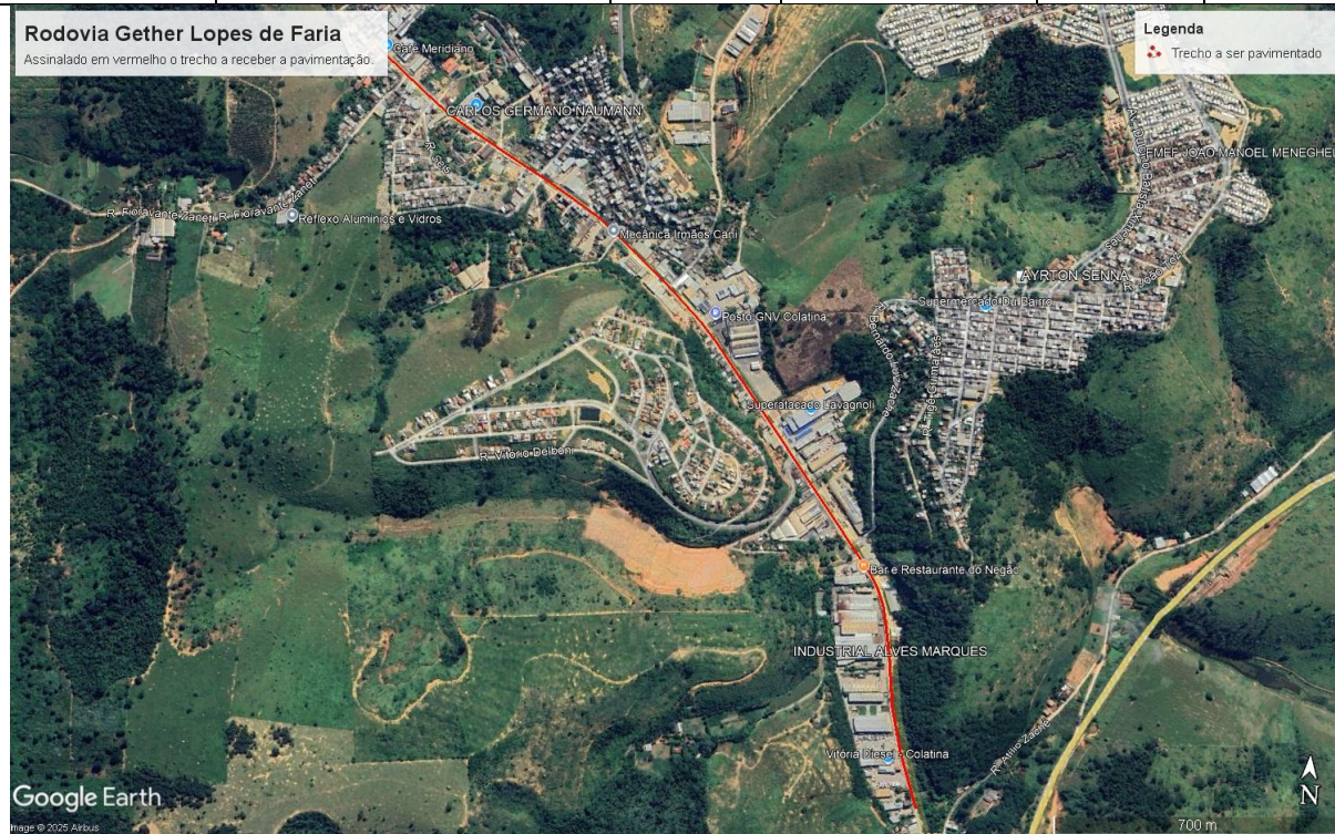
Figura 10 – Localização da obra.

Para a execução do remanescente do Contrato 009/2023, serão considerados: