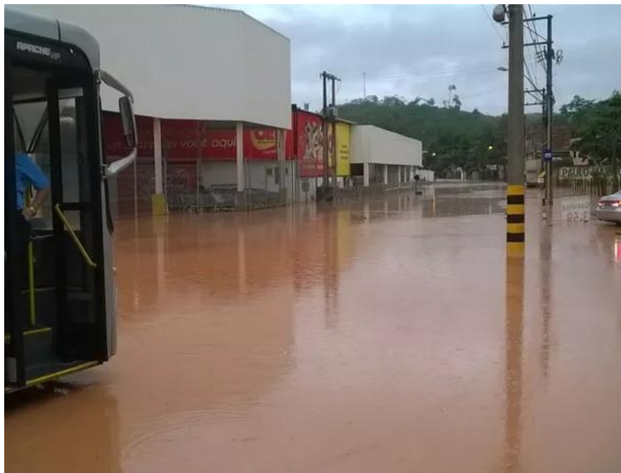
Avenida do Carlos Germano Naumann ficou sem passagem