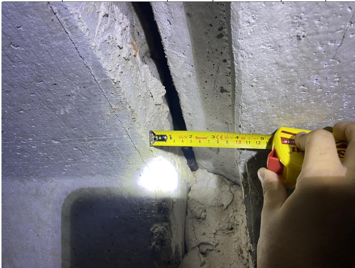
Figura 05: Locais com aberturas de rejuntamento de tamanho inadmissível.

HASH: fcc7a2c6cfff8bdc7815cd66e8505f5433b88f97dbe1c526236-RCTMQR6-LE-DGCS-DCCJMENTO-CRGINALS://s.08/04/2026/161634-pu-ÁGINA090152WYK-26BK-CK6. Assinado por: REINALDO BARBOSA MARTINS em 08/04/2026.