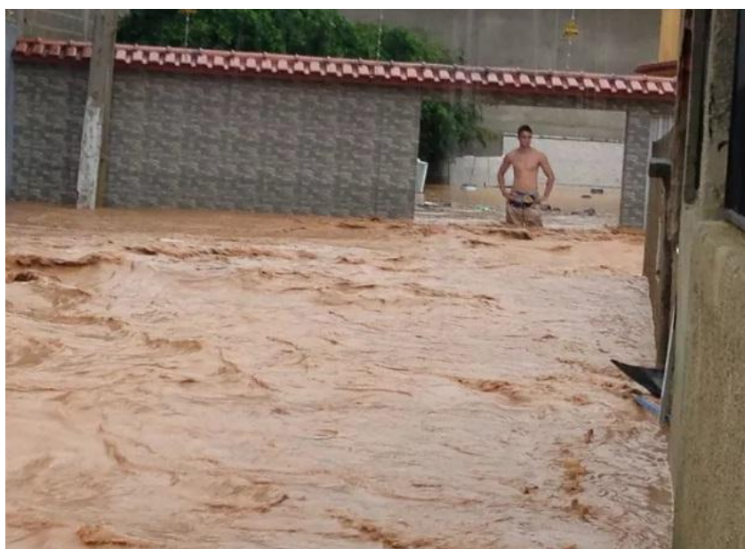
Chuva forte provocou alagamento no bairro Carlos Germano Naumann em Colatina

Av. Dr. Olívio Lira, 353, Centro Comercial Praia da Costa, 19º andar – Praia da Costa, Vila Velha/ES CEP: 29.055-450 - Tel.: 27 3636-5041 / 27 3636-5042