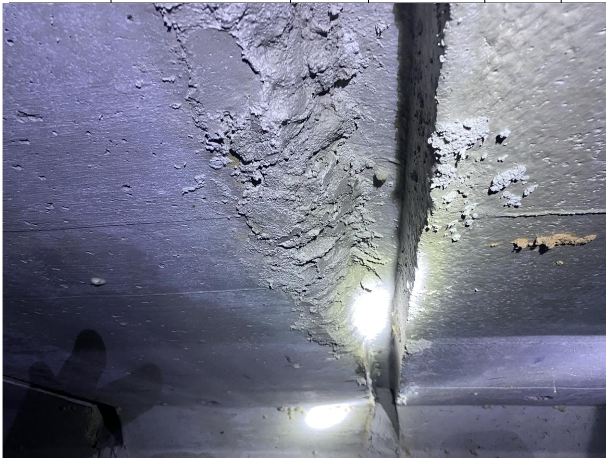
Figura 06: Reparos de forma desconforme com o determinado pela fiscalização.

No mês de dezembro/2025, a contratada, contrariando as determinações e notificações da fiscalização, desmobilizou a frente de serviço responsável pelos reparos, e continuou realizando pequenos serviços de calçada e no parque linear, porém com produtividade muito aquém da necessária para a conclusão do contrato, com base no cronograma físico-financeiro do contrato.