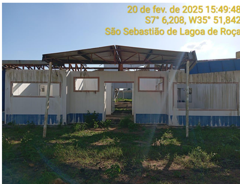
Figura 12 – Fachada – Paredes e cobertura