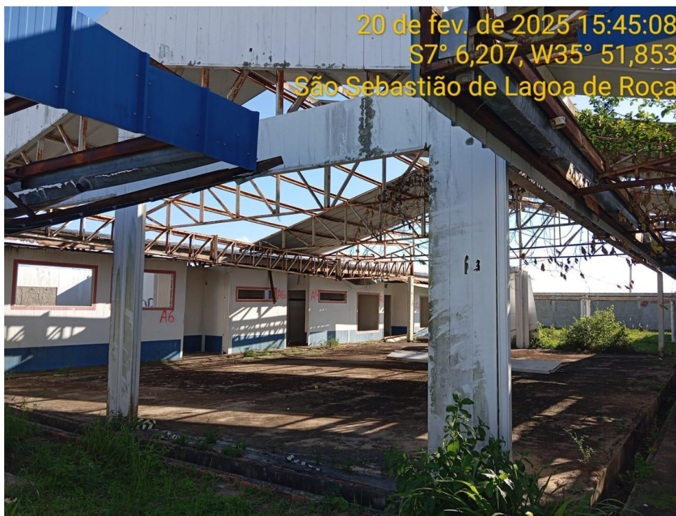
Figura 11 – Pátio coberto – Paredes, cobertura, contrapiso