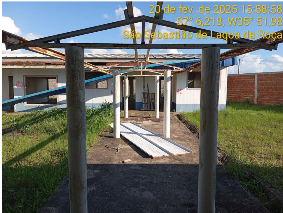
Figura 2 – Passarela