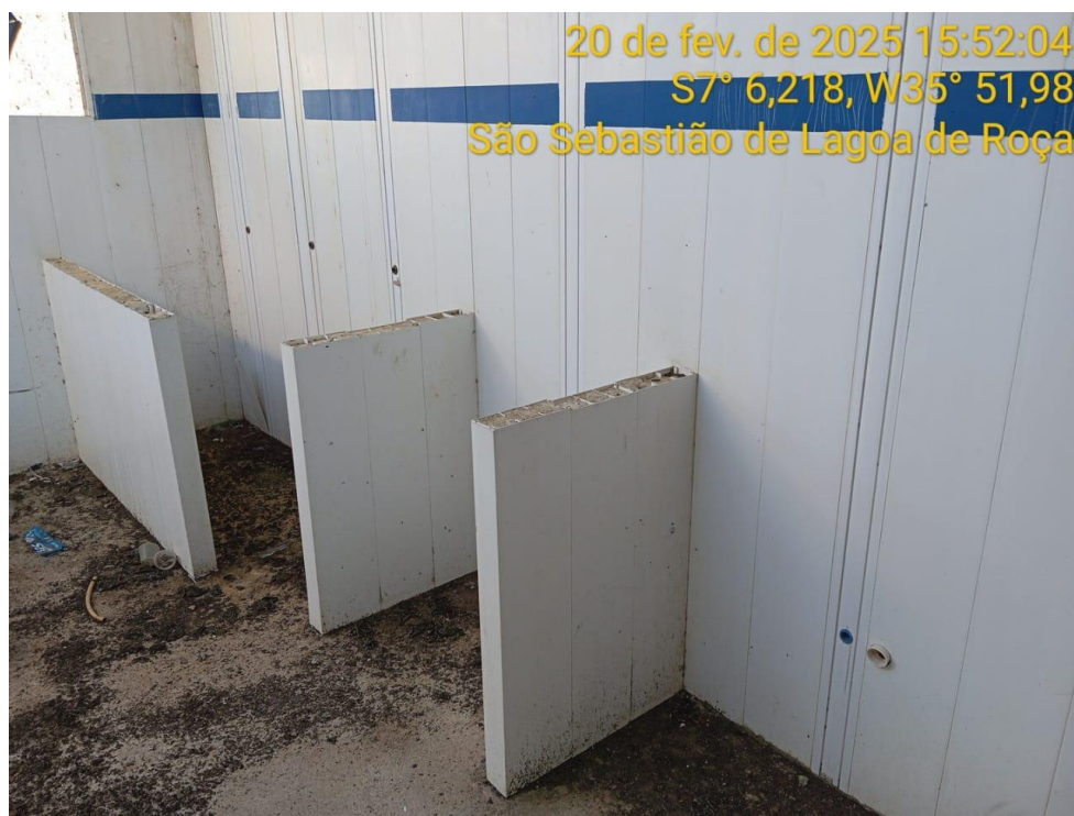
Figura 8 – Vista interior da creche - Instalações sanitárias