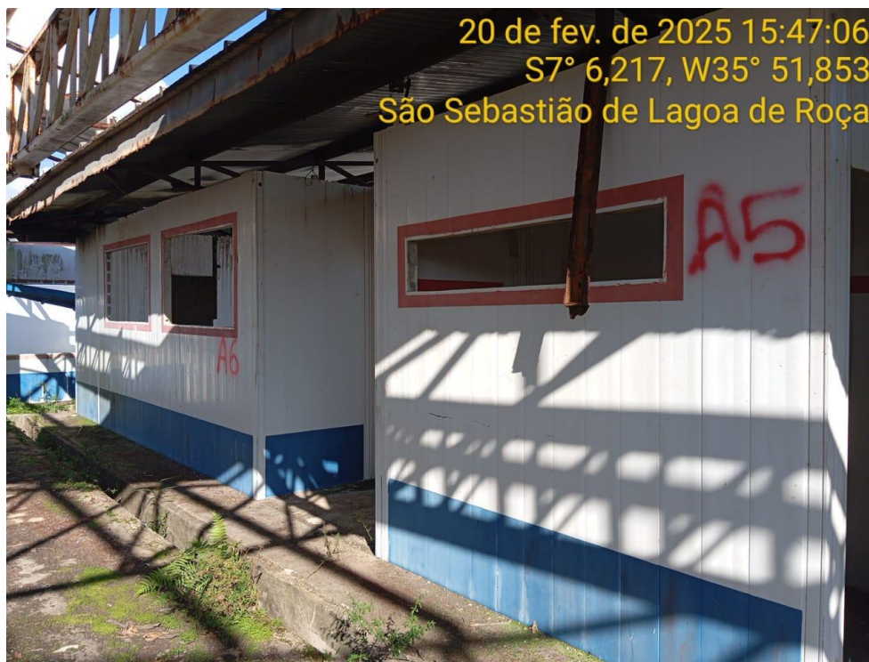
Figura 7 –Vista externa da creche - Paredes e cobertura