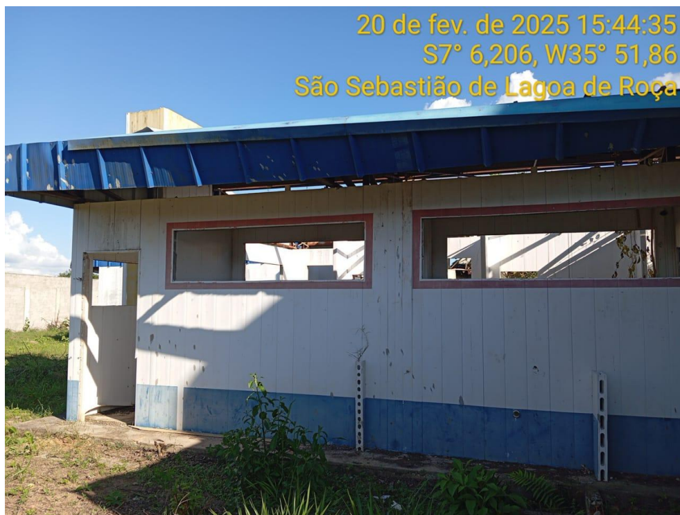
Figura 21 – Vista externa da creche – Paredes instaladas, cobertura e calçada