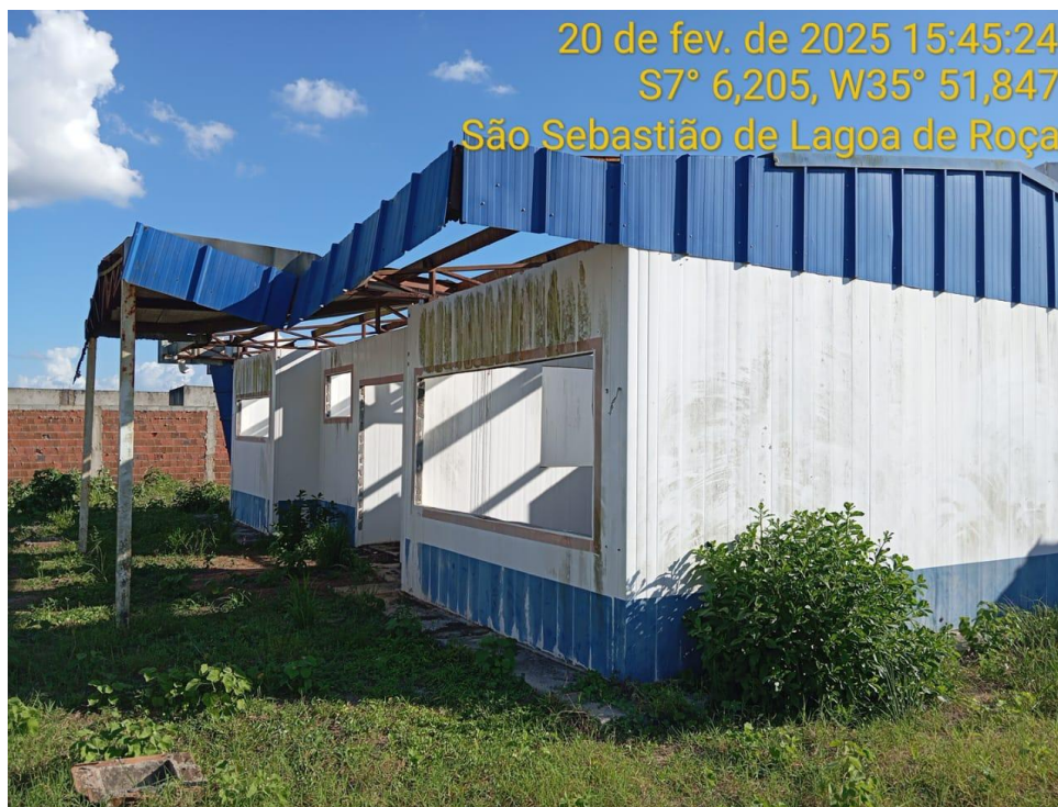
Figura 18 – Fachada da creche – Paredes instaladas e Cobertura