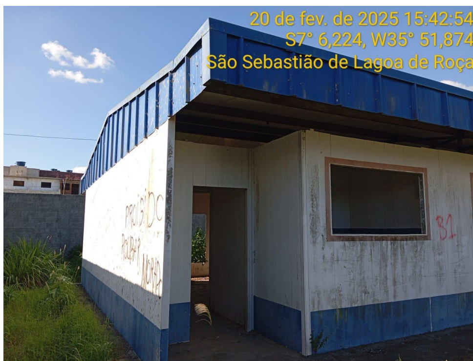
Figura 4 – Vista externa da creche - Paredes e cobertura