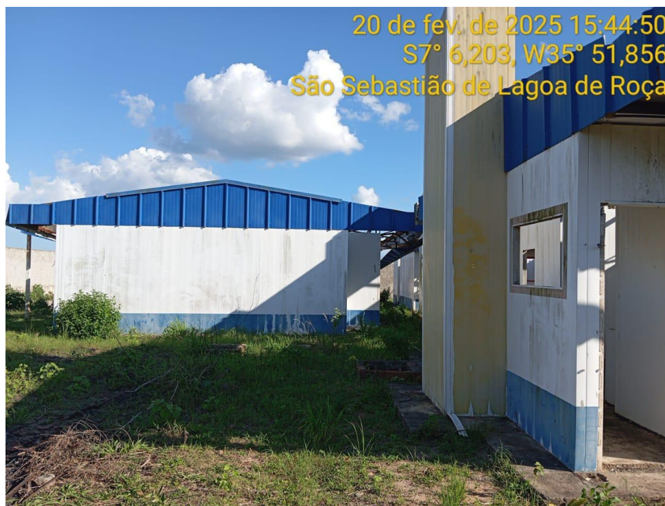
Figura 6 – Vista externa da creche - Paredes e cobertura