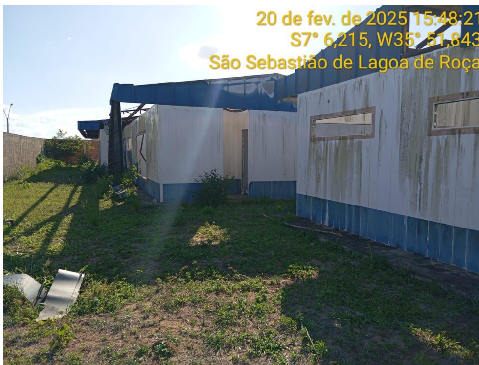
Figura 13 – Vista externa da creche – Paredes e Cobertura