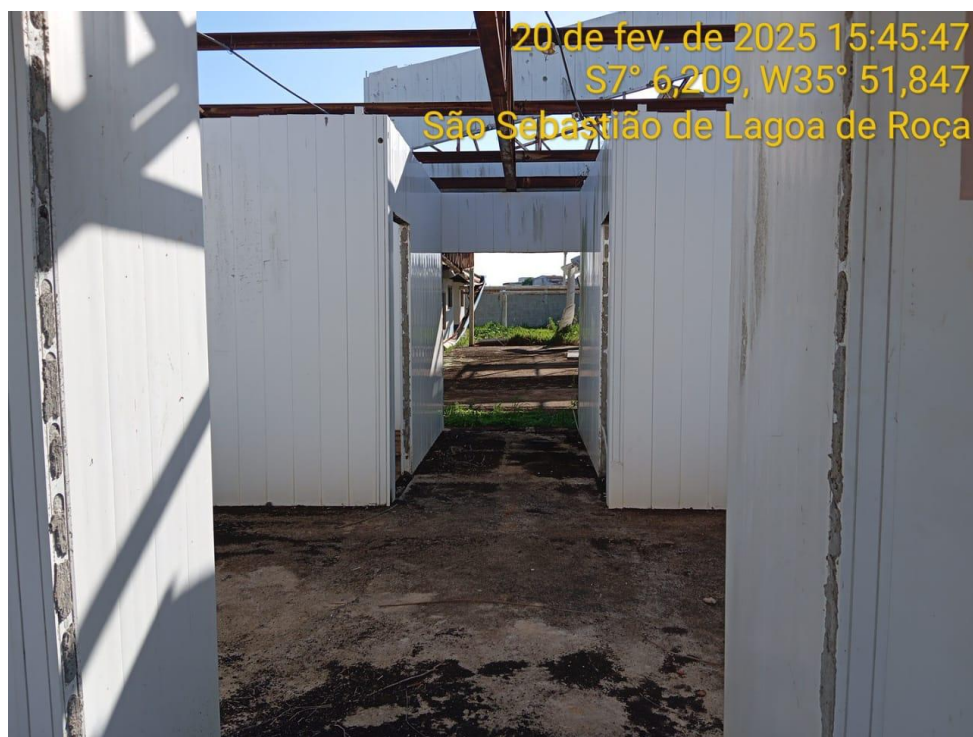
Figura 17 – Vista interna da creche – Paredes instaladas, estrutura metálica e contrapiso