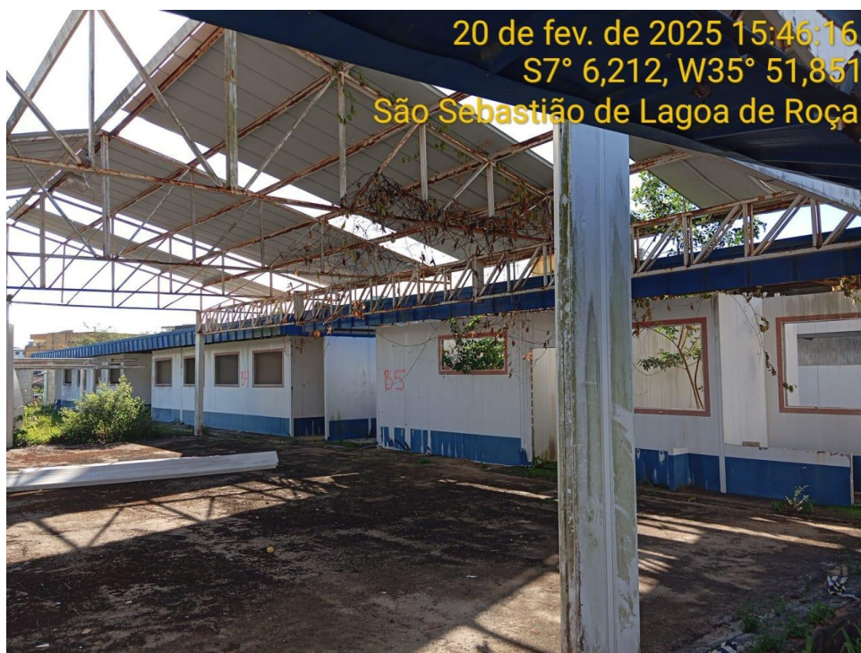
Figura 10 – Pátio coberto – Paredes, cobertura, contrapiso