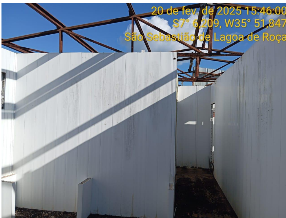
Figura 19 – Vista interna da creche – Paredes instaladas, estrutura metálica e contrapiso