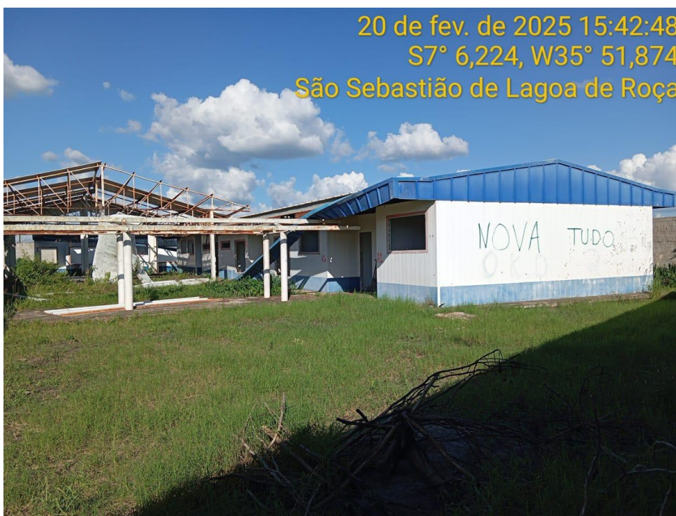
Figura 15 – Vista externa da creche – Paredes, Cobertura, Passarela e Pátio