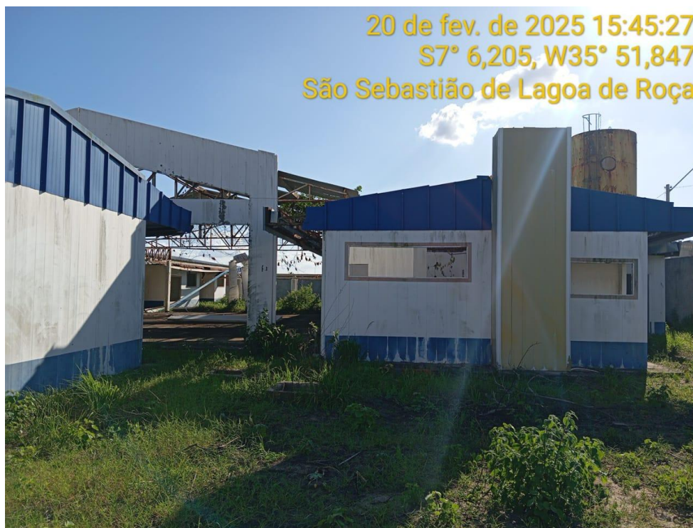
Figura 14 – Vista externa da creche – Paredes e Cobertura