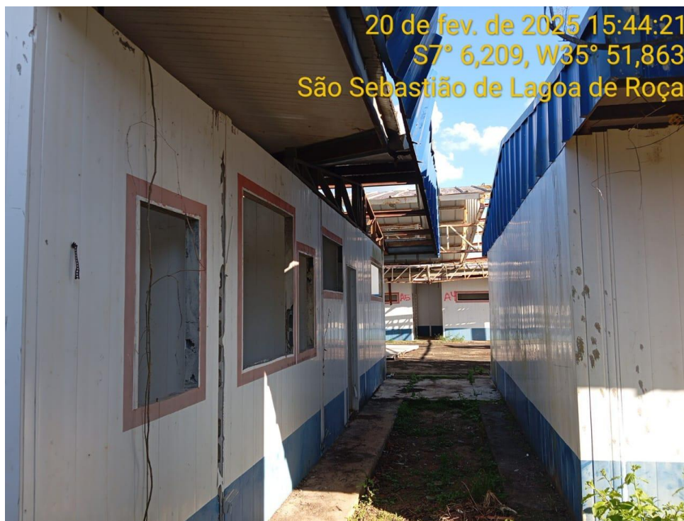
Figura 5 – Vista externa da creche - Paredes e cobertura