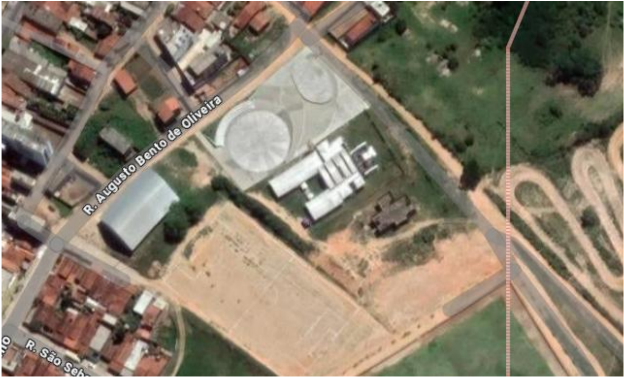
Figura 1 – Fonte: Google Earth (2025)