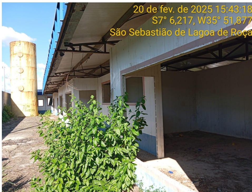
Figura 3 – Vista externa da creche – Paredes, cobertura e castelo d'água