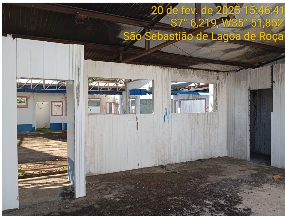
Figura 9 – Vista interior da creche – Paredes, cobertura, contrapiso