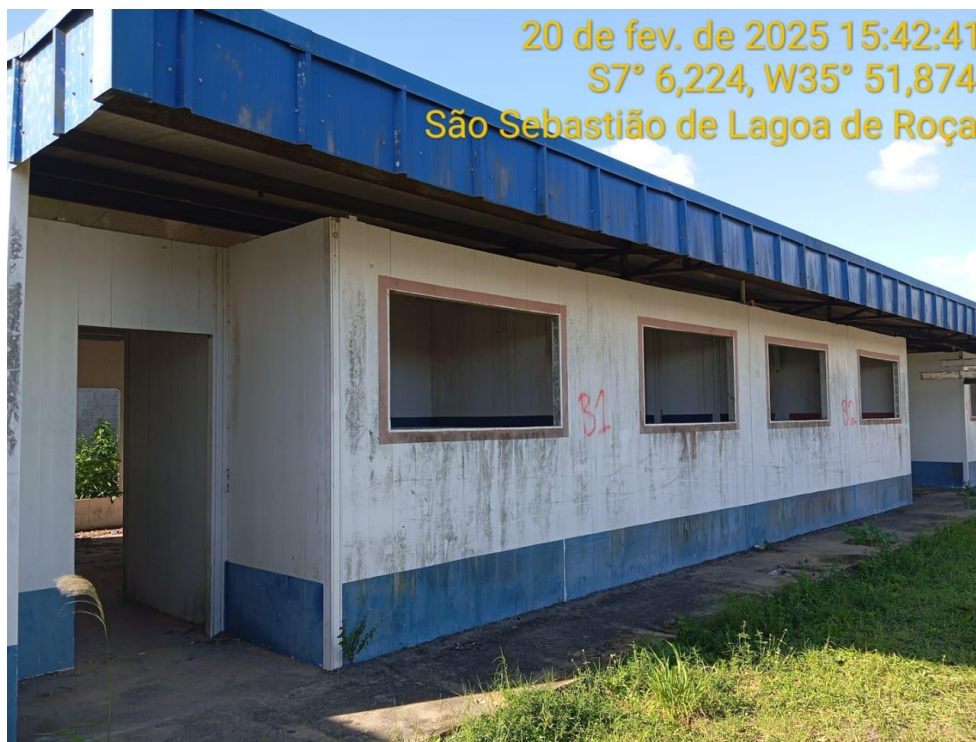
Figura 16 – Vista externa da creche – Paredes, Cobertura e calçada