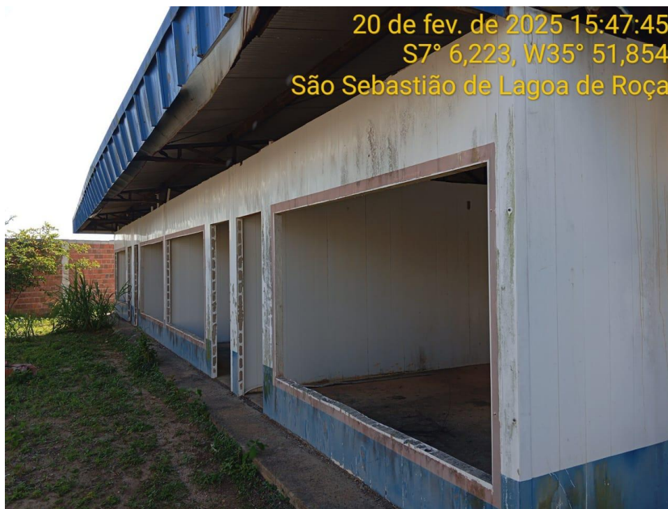
Figura 21 – Vista externa da creche – Paredes instaladas, cobertura e calçada

Foram executados os serviços preliminares, as fundações, os painéis PVC, a estrutura metálica, parte da cobertura e parte das instalações hidráulicas e elétricas.