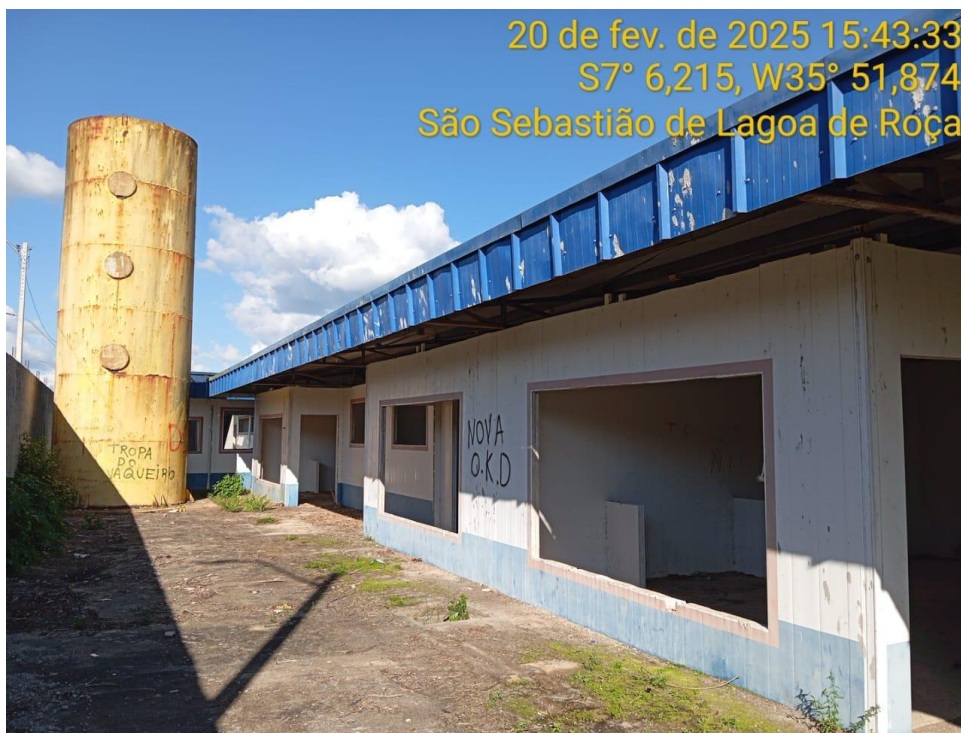
Figura 20 – Vista externa da creche – Paredes instaladas, cobertura e castelo D'água