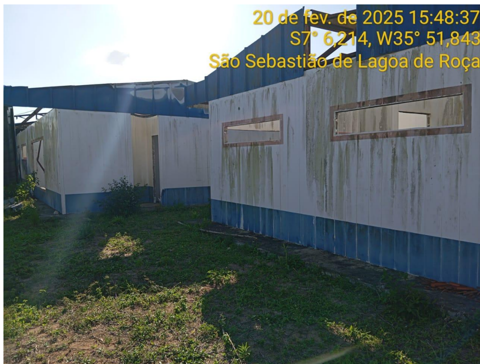
Figura 12 – Vista externa da creche – Paredes e Cobertura