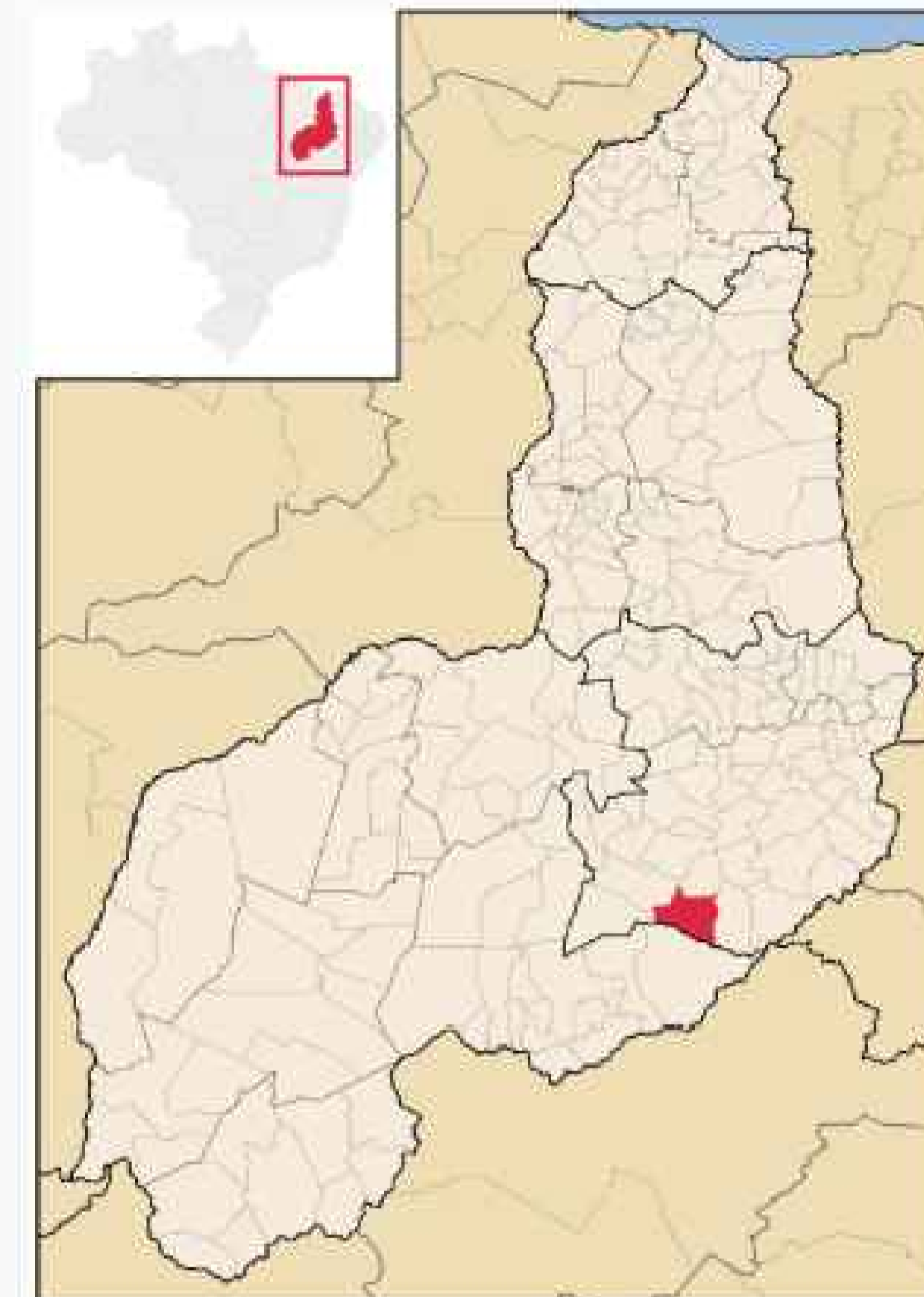
Localização de Capitão Gervásio Oliveira no Piauí