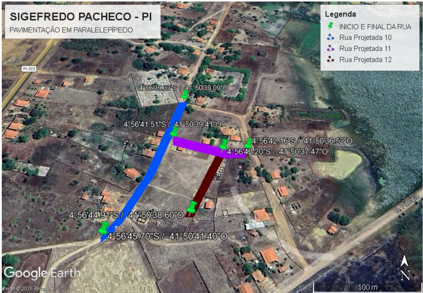
2. FOTOS COM COORDENADAS GEOGRÁFICAS.