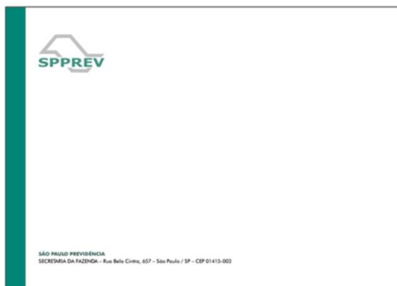
3.1.4 Item 4 - Ilustração