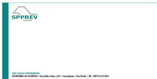
3.1.3 Item 3 - Ilustração