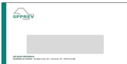
3.1.2 Item 2 - Ilustração