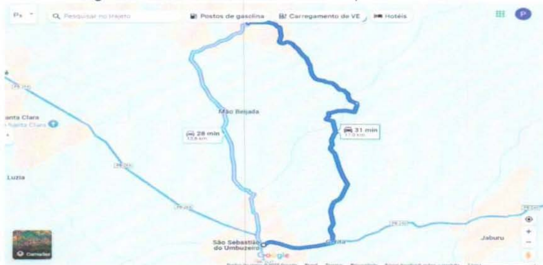
Figura 2 – Distância entre a Sede do município e o seu distrito

Fonte: Google Maps – Disponível em: < 000485