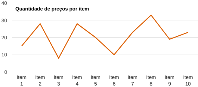
Quantidade de preços por item