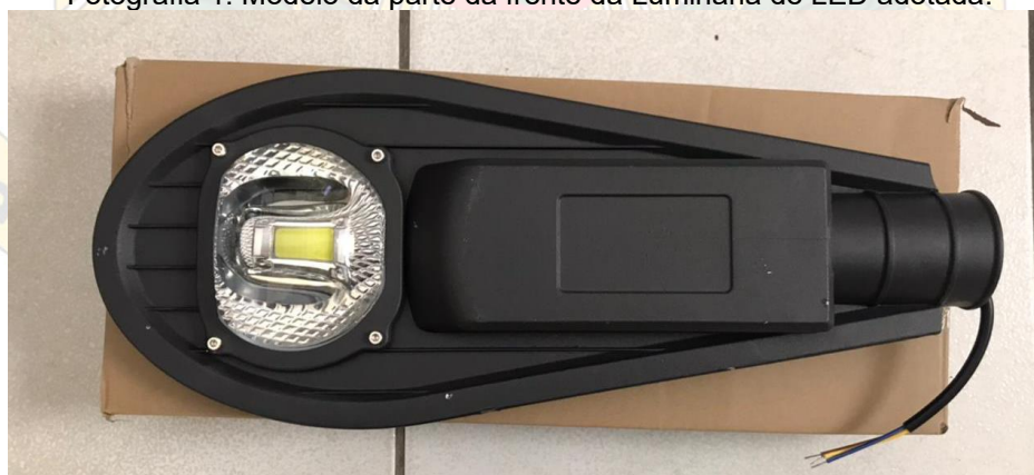
Fotografia 1: Modelo da parte da frente da Luminária de LED adotada.