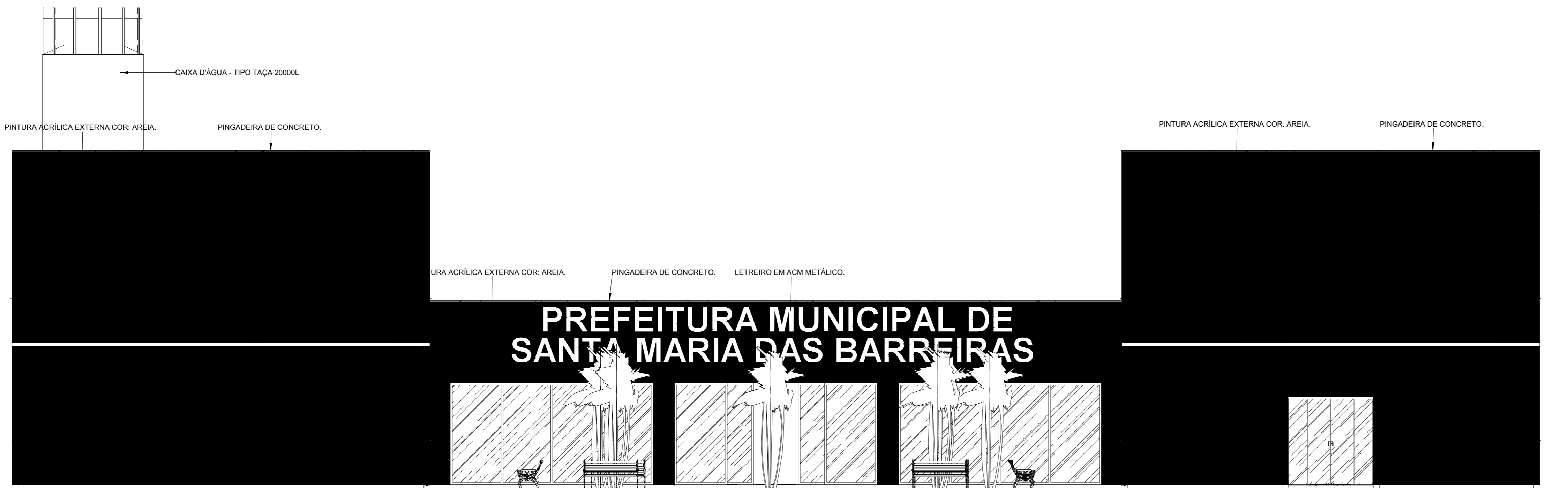
FACHADA FRONTAL 1:65