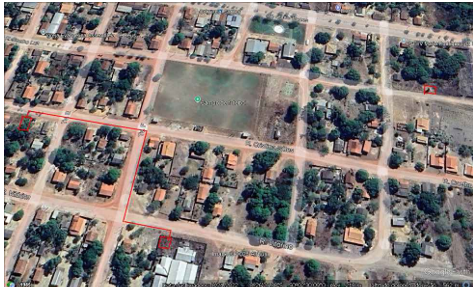
PLANTA DE LOCAÇÃO DO SISTEMA 1 E 2 E ADUTORA