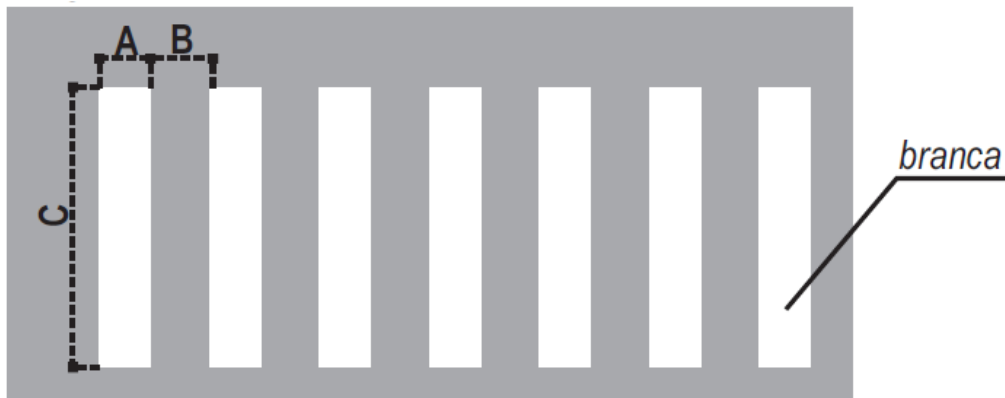
Detalhe Faixa Tipo Zebrada.