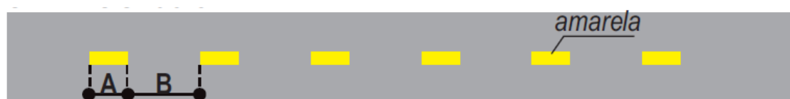
Detalhe Faixa Seccionada.