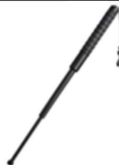
BASTÃO RETRÁTIL TELESCÓPICO