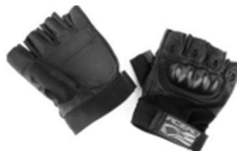
LUVAS TATICAS OPERACIONAIS