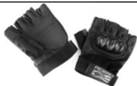
LUVA DE PROCEDIMENTO