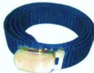
CINTO DE PASSEIO