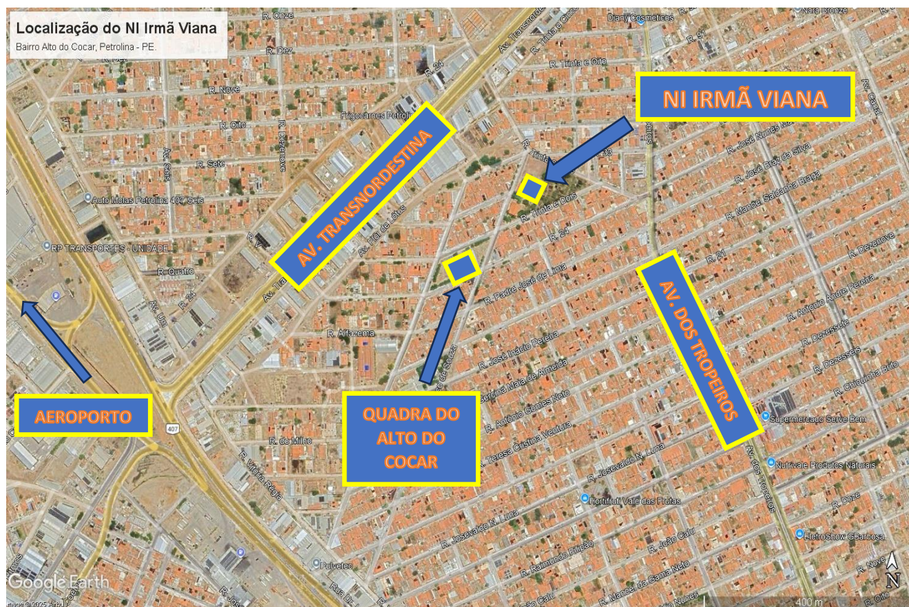
Figura 1 - Localização do NI IRMÃ VIANA, no Bairro Alto do Cocar;

O referido imóvel onde funciona atualmente a NOSSA INFÂNCIA IRMÃ VIANA , está localizada na Avenida da Mirra (rua 26) do Bairro Alto do Cocar, zona norte deste município.