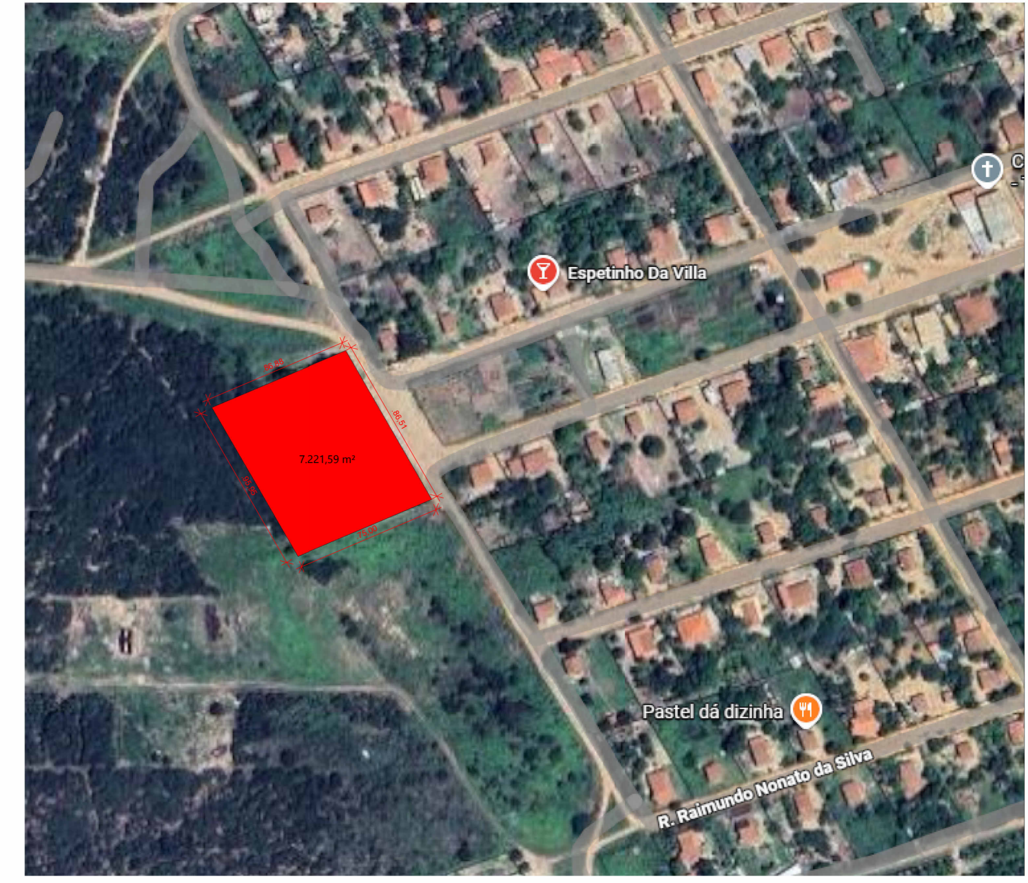
03 PLANTA DE SITUAÇÃO ESCALA 1:2000