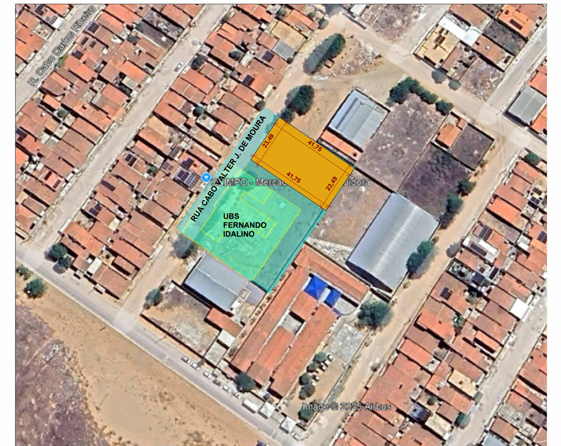
01 PLANTA DE SITUAÇÃO - SATÉLITE ESCALA 1:1000