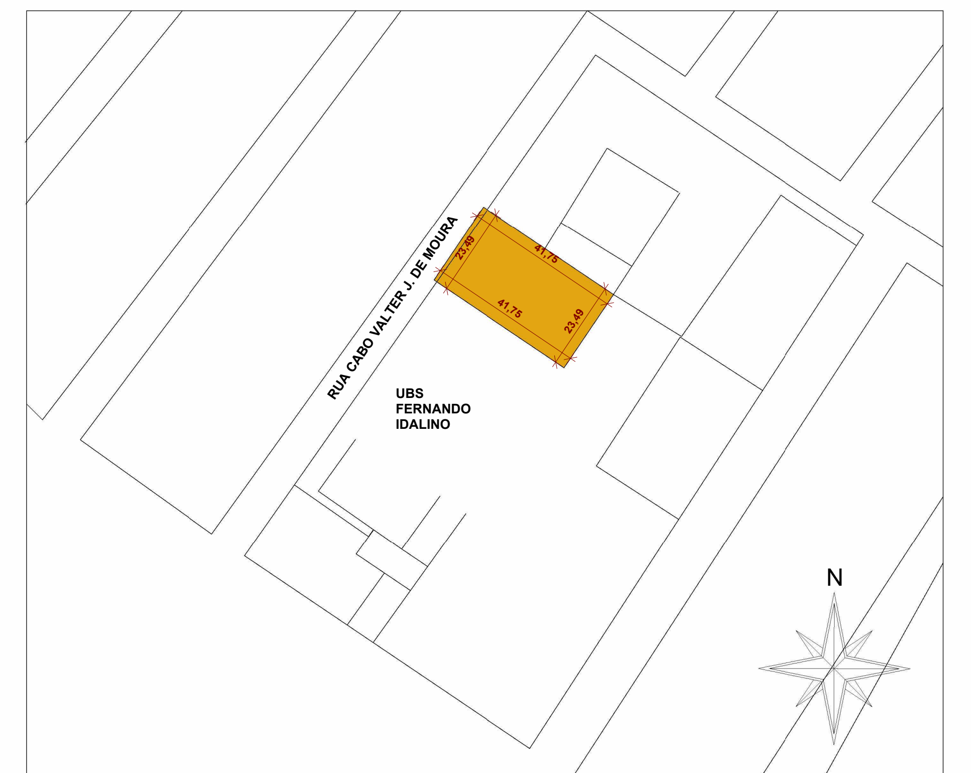
02 PLANTA DE SITUAÇÃO ESCALA 1:1000