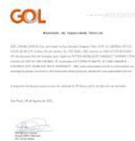
CARTA PATRIA - GOL.png 96K