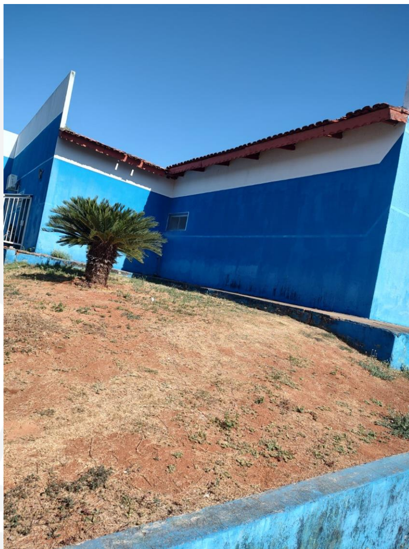
Figura 01: Localização proposta para construção da cabine do Gerador.