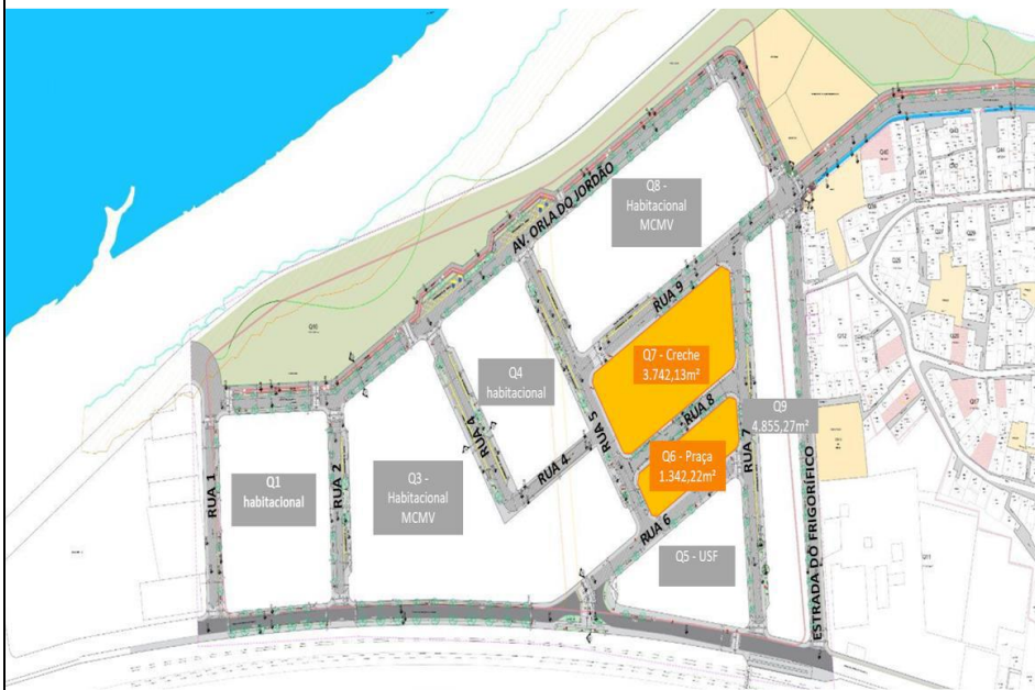
Figura 1: Planta de Situação da Creche e da Praça Pública, na Comunidade do Bem.

O escopo das intervenções abrange, ainda, a pavimentação e a implantação de sistema de drenagem das vias do entorno , visando à melhoria da acessibilidade, à qualificação da infraestrutura urbana e ao adequado atendimento à população local.