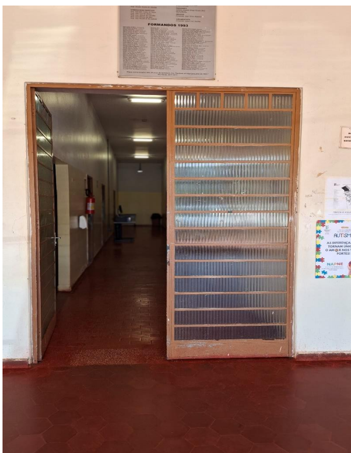
Figura 8 - Porta metálica e ponto para interfone

Remoção de estruturas e portas metálicas com reaproveitamento e instalação de vidro temperado 10 mm (Figuras 9, 10, 11 e 12)