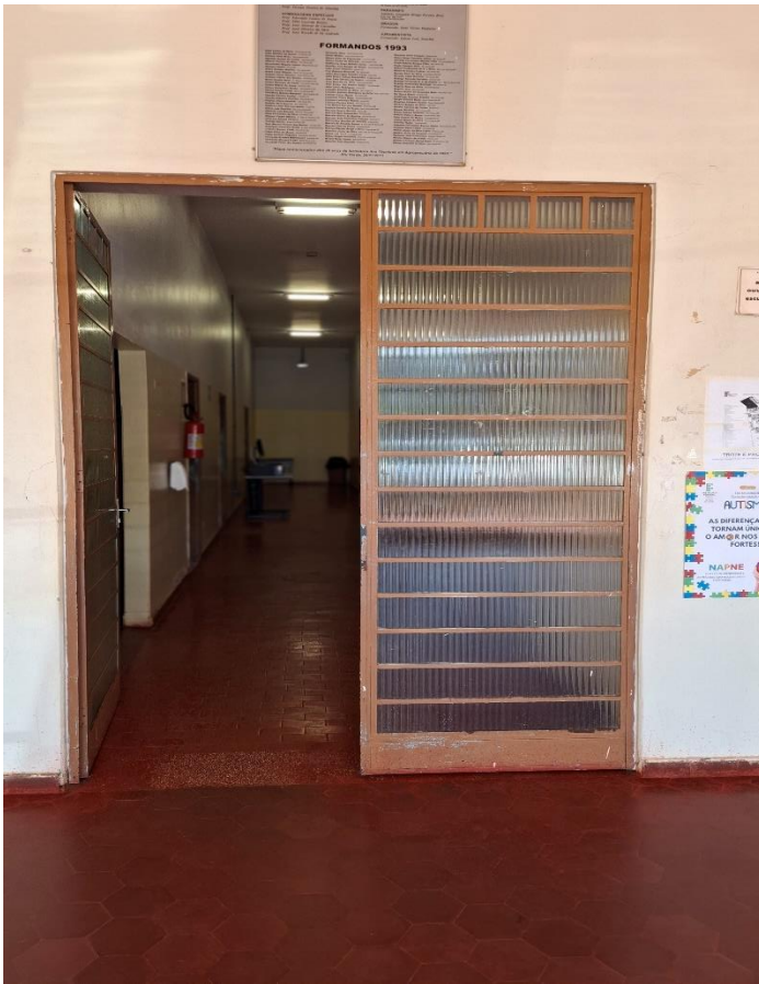
Figura 8 - Porta metálica e ponto para interfone

Remoção de estruturas e portas metálicas com reaproveitamento e instalação de vidro temperado 10 mm (Figuras 9, 10, 11 e 12)