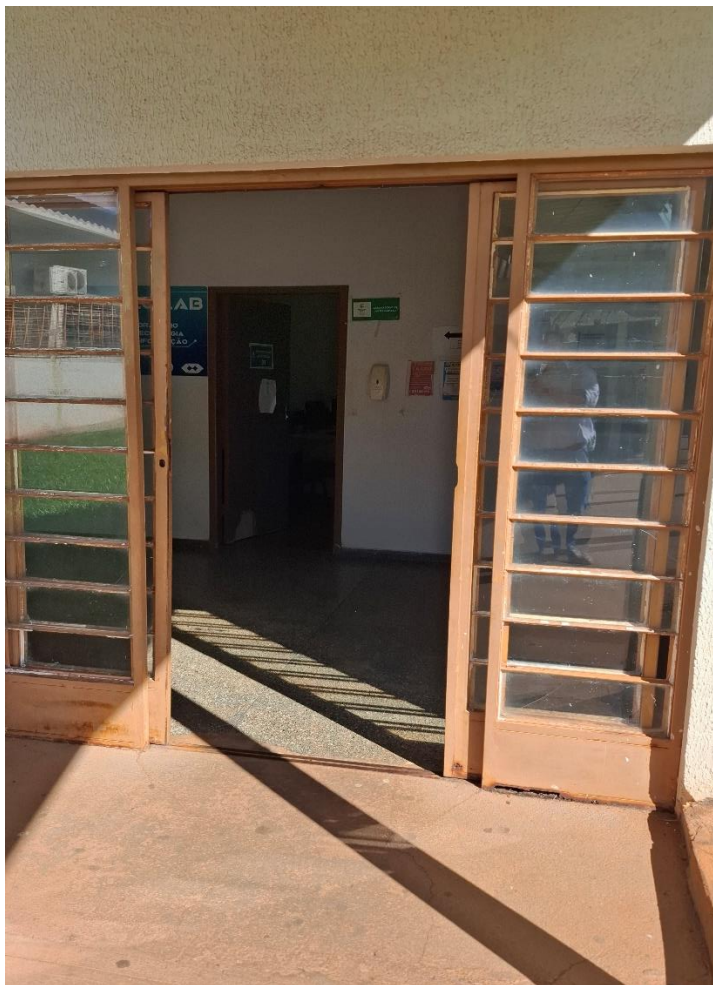
Figura 7- Porta metálica correr

Recuperação de porta metálica e instalação de interfone (figura 8)