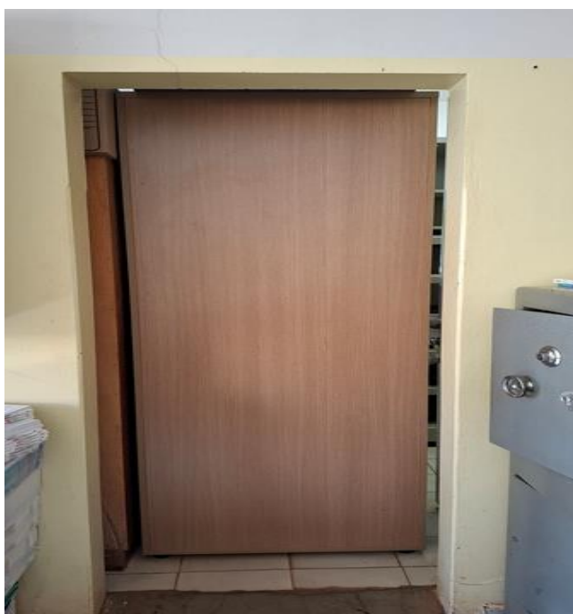
Figura 4- Vão de porta sala de professores