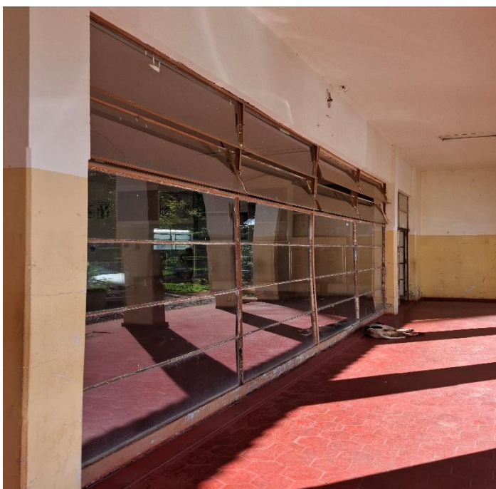
Figura 9- Estrutura metálica com vidro a ser removida

Remoção de estruturas e portas metálicas com reaproveitamento e instalação de vidro temperado 10 mm (Figuras 9, 10, 11 e 12)