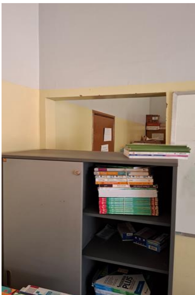
Substituição de portas de madeira salas de professores (figuras 5 e 6)