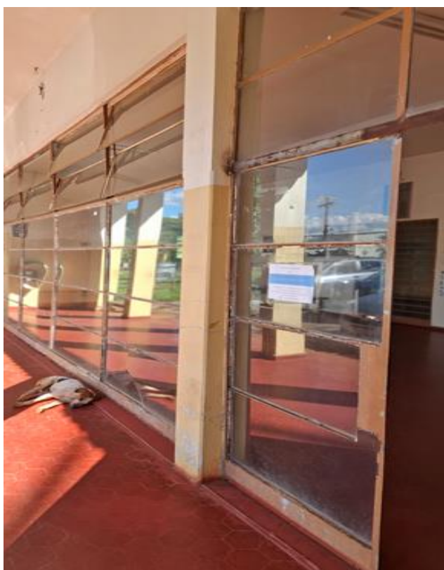
Figura 11- Local de instalação de vidro temperado