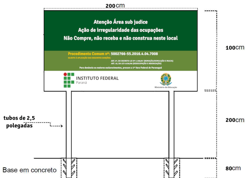
Fig. 01 - Frente da placa com as indicações de medidas.

6.3 A instalação das placas nos 05 (cinco) locais indicados anteriormente deverá ser realizada conforme croquis abaixo: