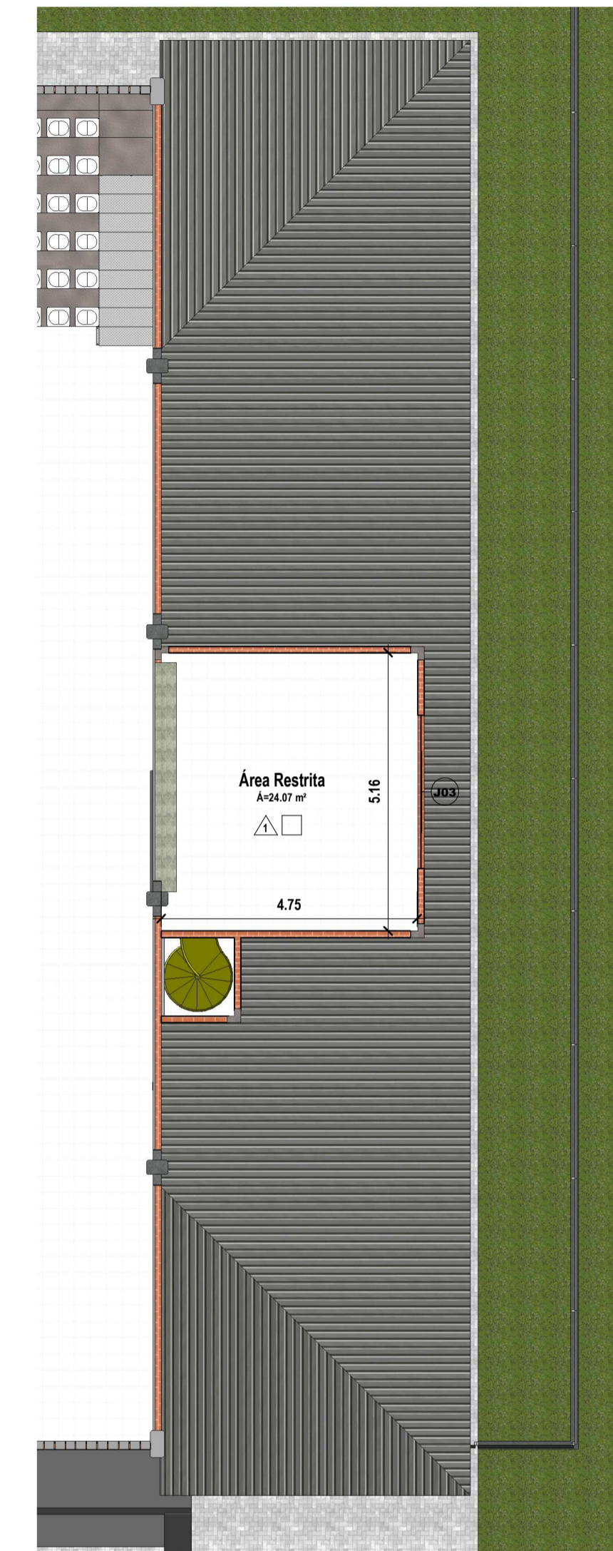
14 Pavimento Superior 1 : 100