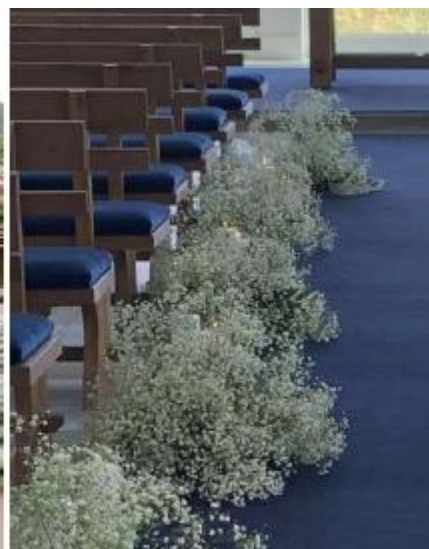
Imagem 07 – Item 16

Tapete passadeira para passarela na cor cru ou nude.