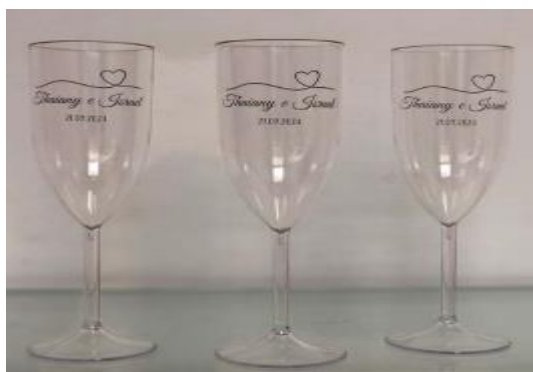
Imagem 04 – Item 12

Taças de espumante personalizadas, em material acrílico transparente ou similar, destinadas ao brinde oficial dos noivos durante a cerimônia.