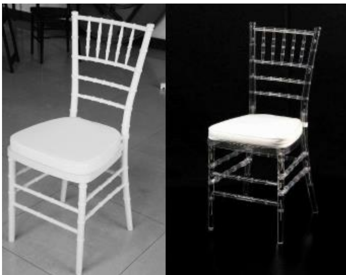
Imagem 09 – Item 18

Cadeiras para convidados em polipropileno, cor branca.