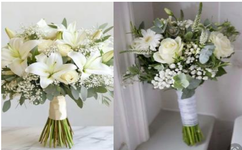
Imagem 12 – Item 21

Buquês para noivas com flores naturais brancas e verdes.