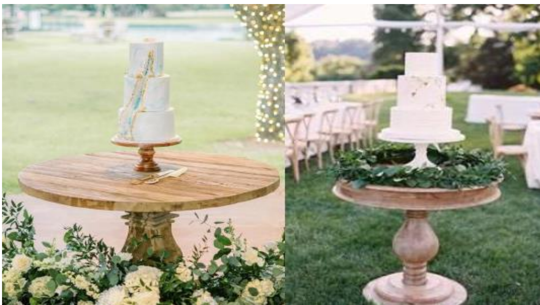
Imagem 15 – Item 24