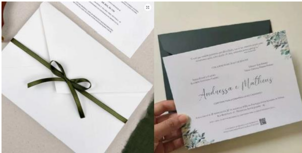
Imagem 02 – Item 5

Convite impresso para o evento, em papel adequado, com layout e arte a serem definidos pela Administração.