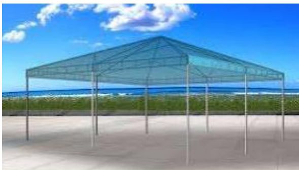
Imagem 23 – Item 34