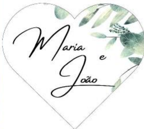
Imagem 13 – Item 22

Tecido voal branco para decoração dos pés das tendas.