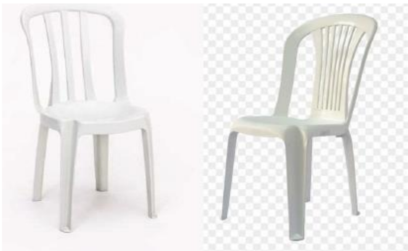
Imagem 10 – Item 19

Cadeiras para convidados em polipropileno, cor branca.