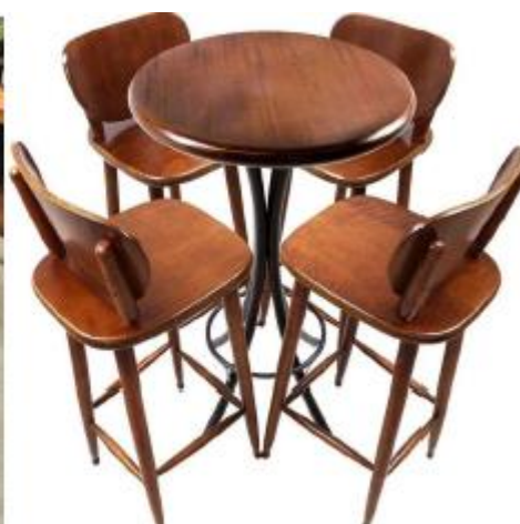
Imagem 20 – Item 29

Mini arranjos florais para mesas bistrôs.