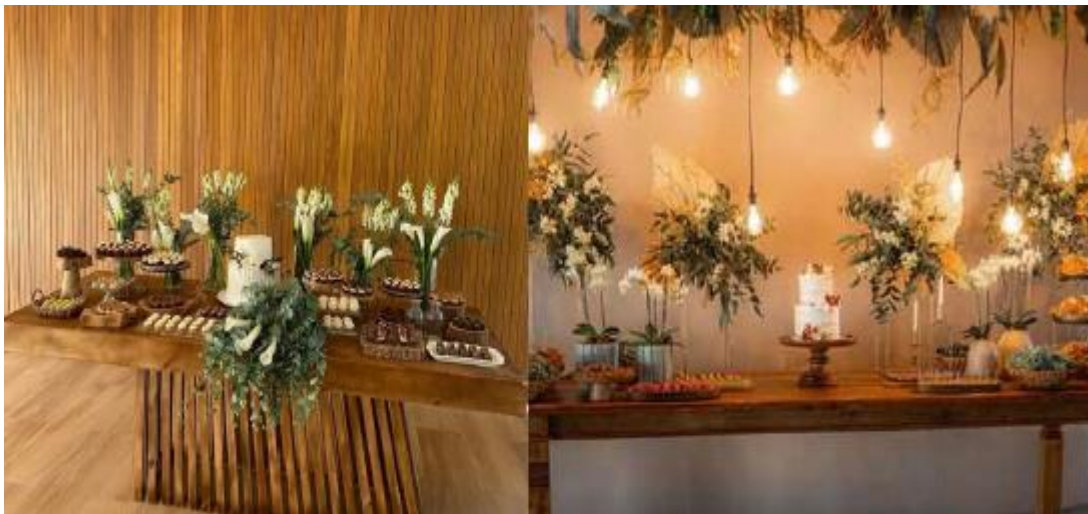
Imagem 22 – Item 33

Mesas retangulares em madeira para buffet e mesa de doces.