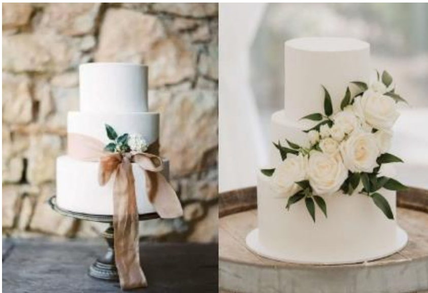
Imagem 17 – Item 26

Lembrancinha para os noivos – topo de bolo personalizado.