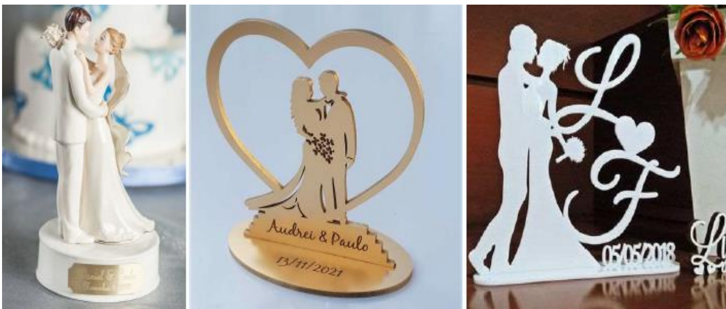
Imagem 18 – Item 27

Lembrancinha para os noivos – topo de bolo personalizado.