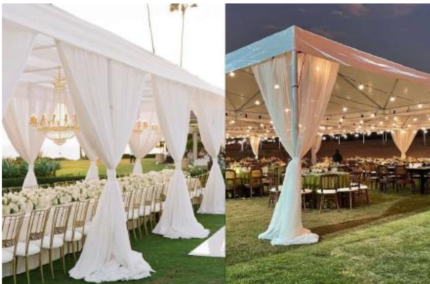
Imagem 14 – Item 23