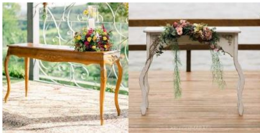
Imagem 05 – Item 14

Arco decorativo para altar em formato circular, com flores naturais brancas e verdes.