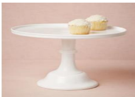
Imagem 16 – Item 25

Bolo decorativo (fake), com até três andares.