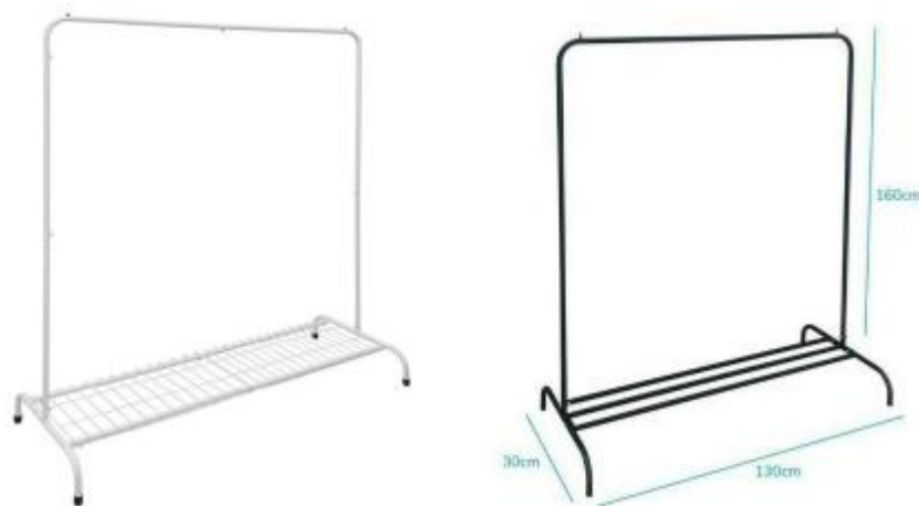
Imagem 11 – Item 20

Camarim para noivas com espelho de corpo inteiro, arara e penteadeira.