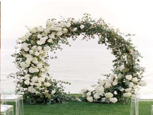
Imagem 06 – Item 15

Arranjos florais de chão para composição da passarela.