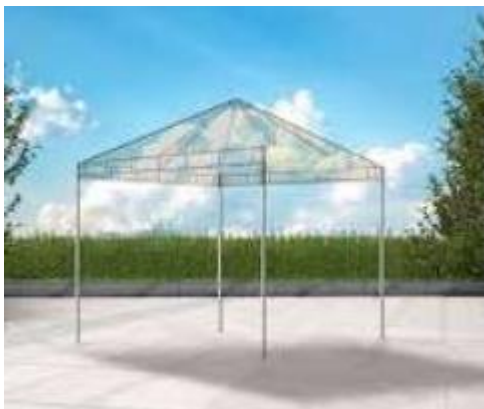
Imagem 24 – Item 35