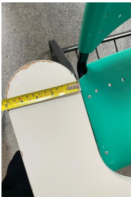
Imagem 6: Medida da largura do braço da cadeira 1 – 12cm