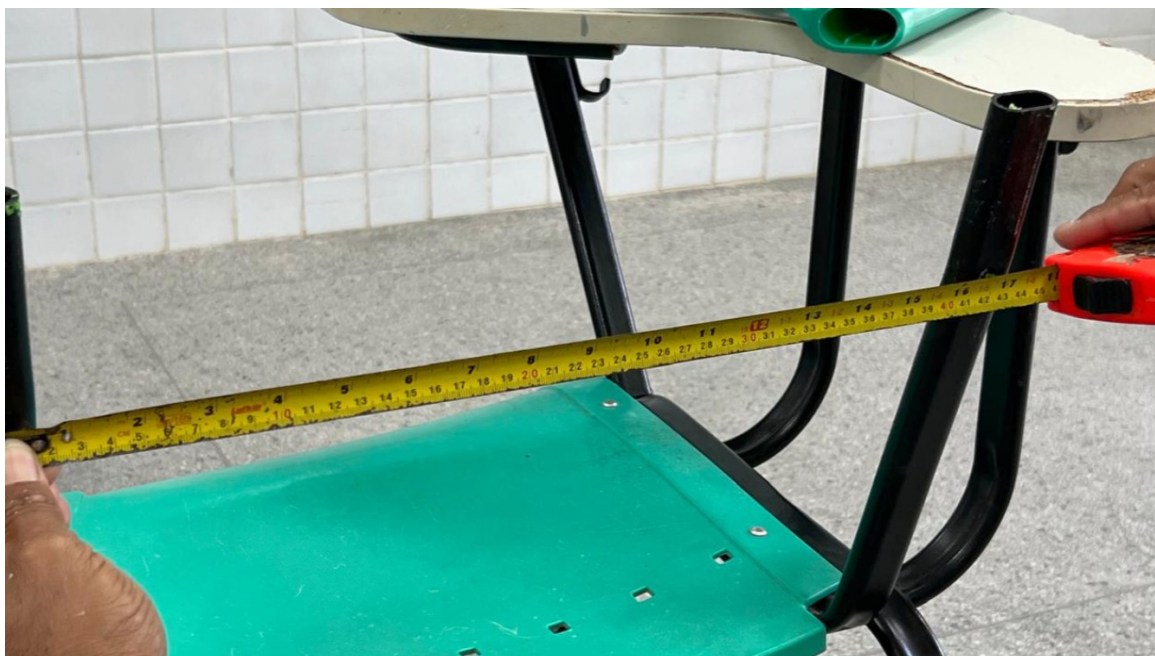
Imagem 1: Medida da parafusação do encosto – 42 cm (variação de 5%)