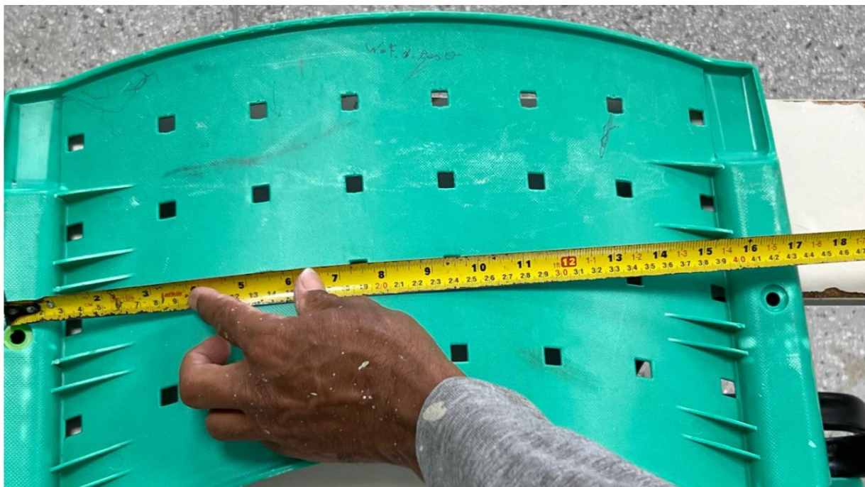
Imagem 2: Medida da parafusação do encosto – 42 cm (variação de 5%)