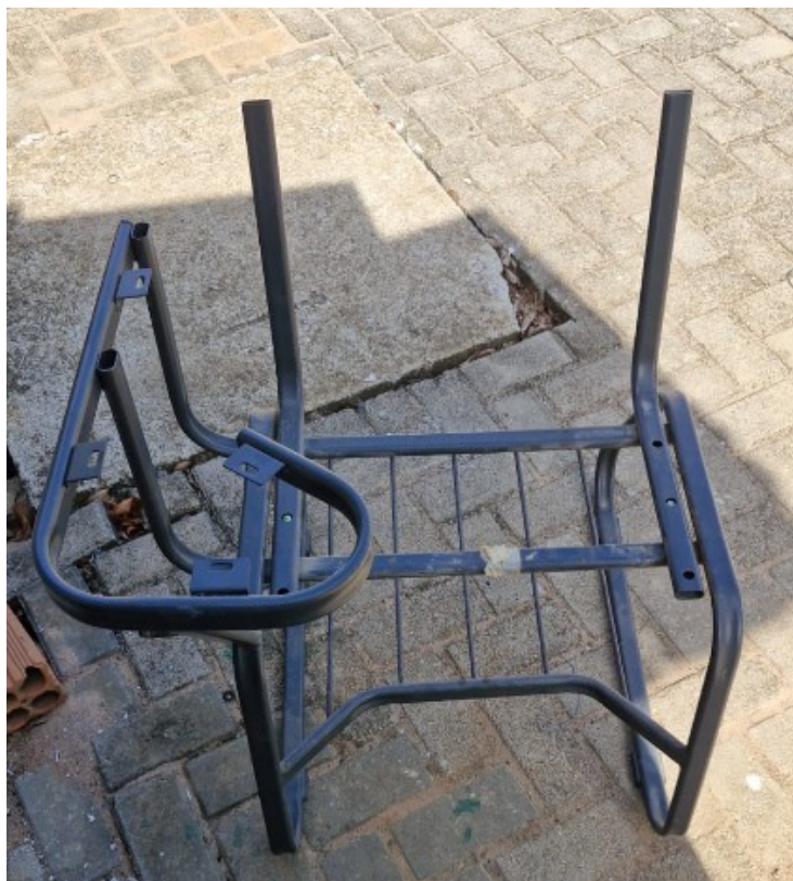
Imagem 5: estrutura em aço na cor preta