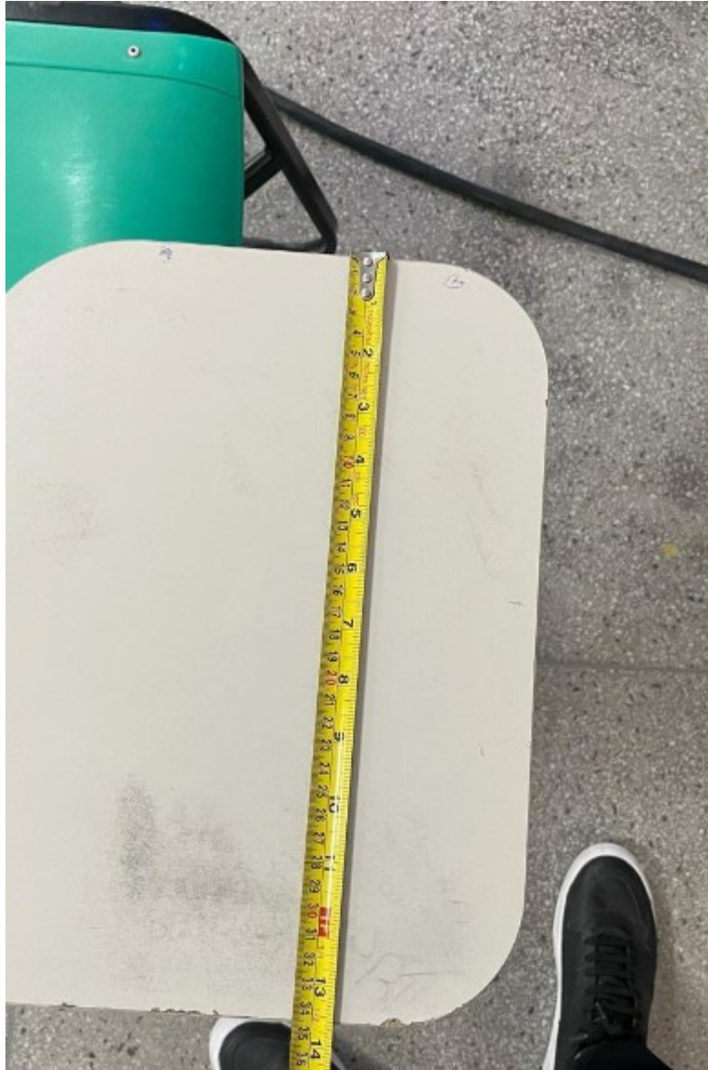
Imagem 7: Medida da largura do braço da cadeira 2 – 34 cm