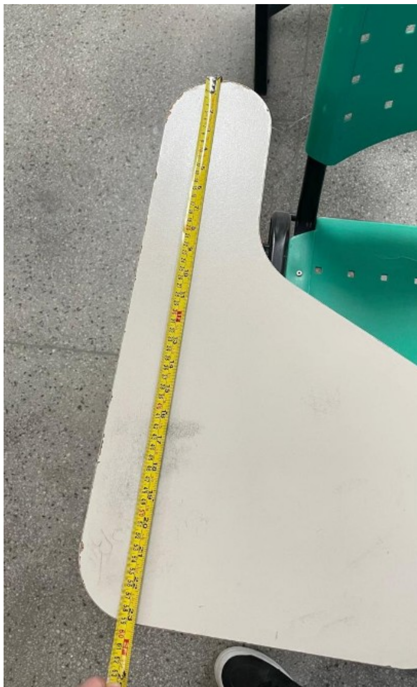
Imagem 8: Medida do comprimento do braço da cadeira – 59 cm