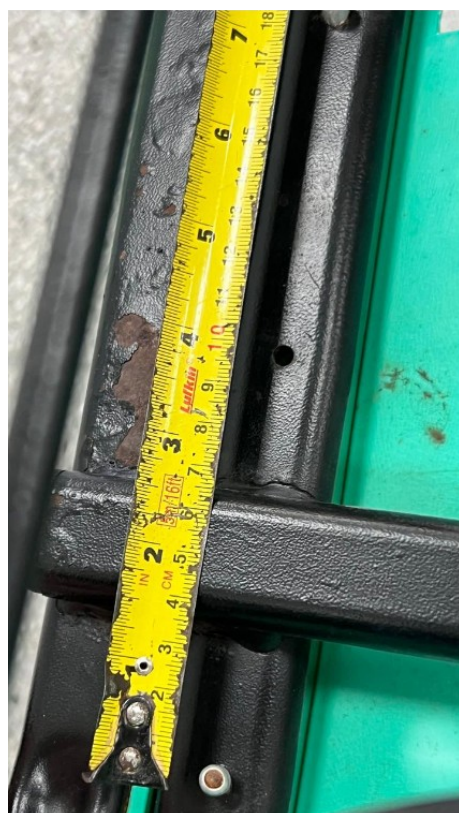
Imagem 4: Medida da parafusão longitudinal ao assento – 10 cm (variação de 5%)