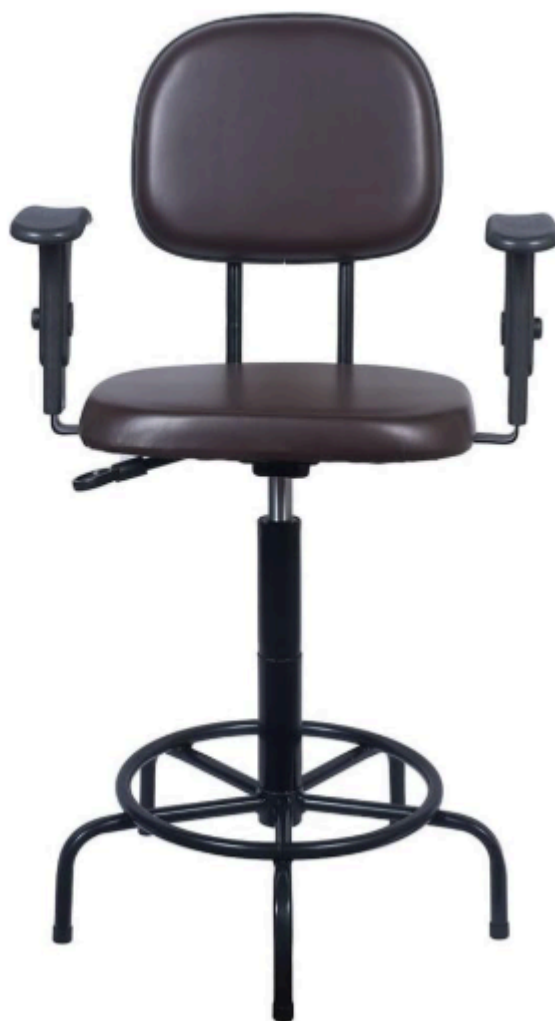
Imagem meramente ilustrativa do item 01 da Dispensa Eletrônica.