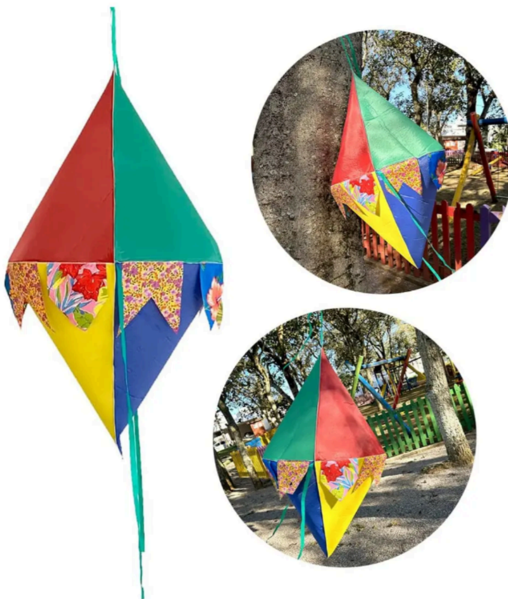
Imagem meramente ilustrativa do item 10 da Dispensa Eletrônica