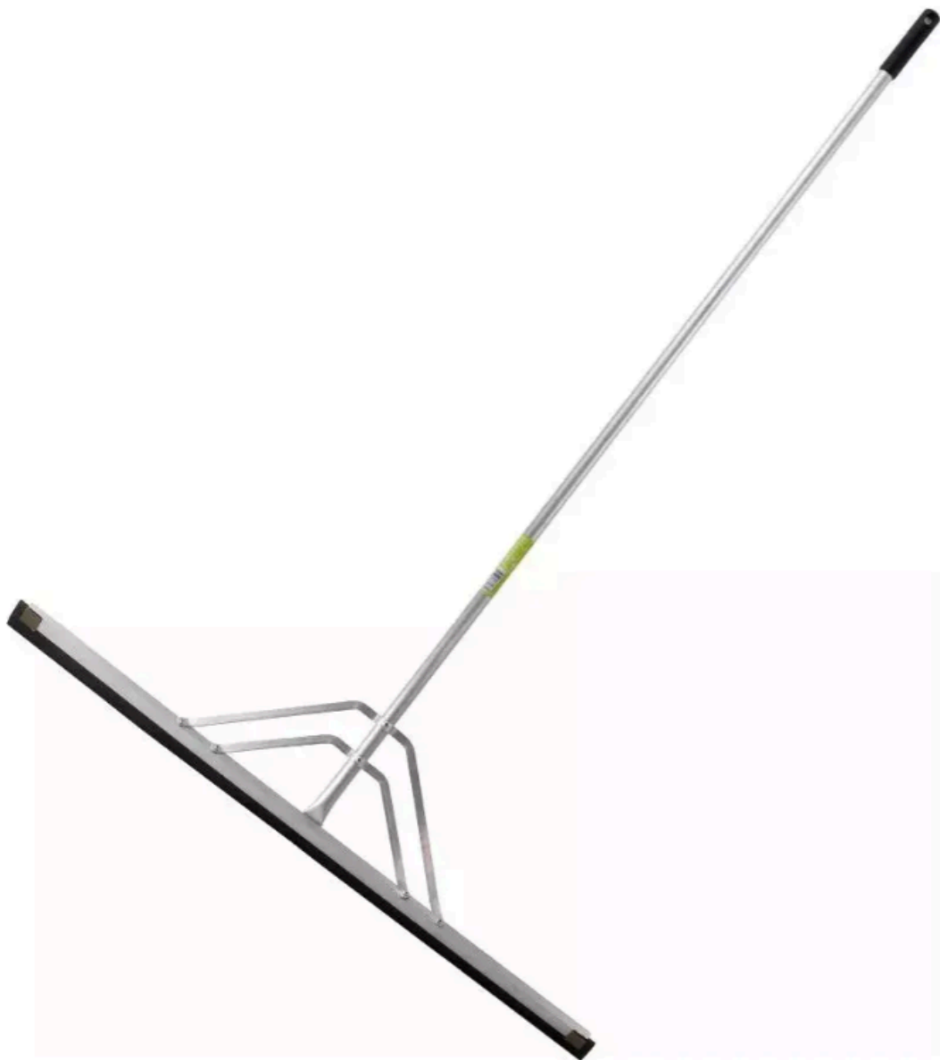
Imagem meramente ilustrativa do item 02 da Dispensa Eletrônica