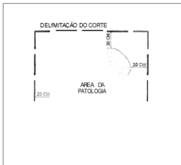
Figura 1 – Delimitação do corte (sem escala)

5.6.2. Realização de requadro em figuras geométricas em ângulo de 90° (retângulo ou quadrado) da abertura a ser reparada, com a utilização de máquina de cortar asfalto com disco diamantado refrigerado de água, martelete ou outros equipamentos adequados a realização do trabalho, deixando as bordas definidas. A abertura da caixa deverá ser feita a 10 centímetros de distância, em todos os quatro cantos, da borda mais distante da patologia, conforme figura abaixo: