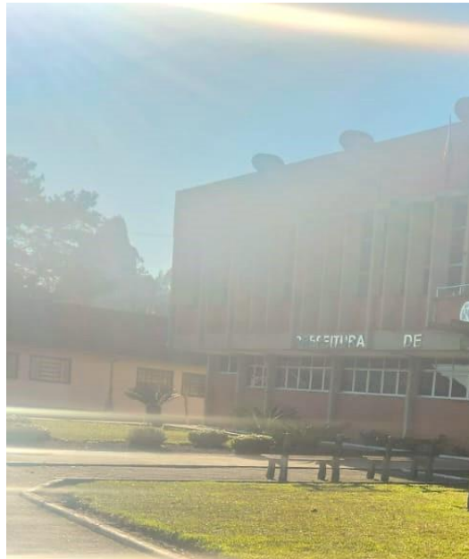
9.8 RIO RUFINO