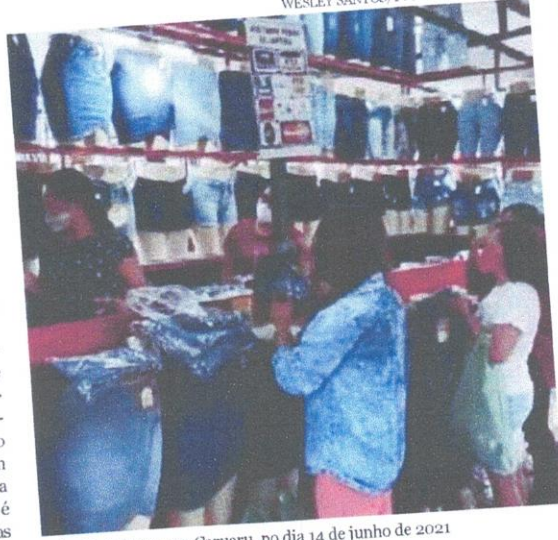
Feira da Sulanca, em Caruaru, no dia 14 de junho de 2021

Entidades, feirantes e empresários alertam para risco aos empregos e cobram isonomia tributária após fim da taxaço