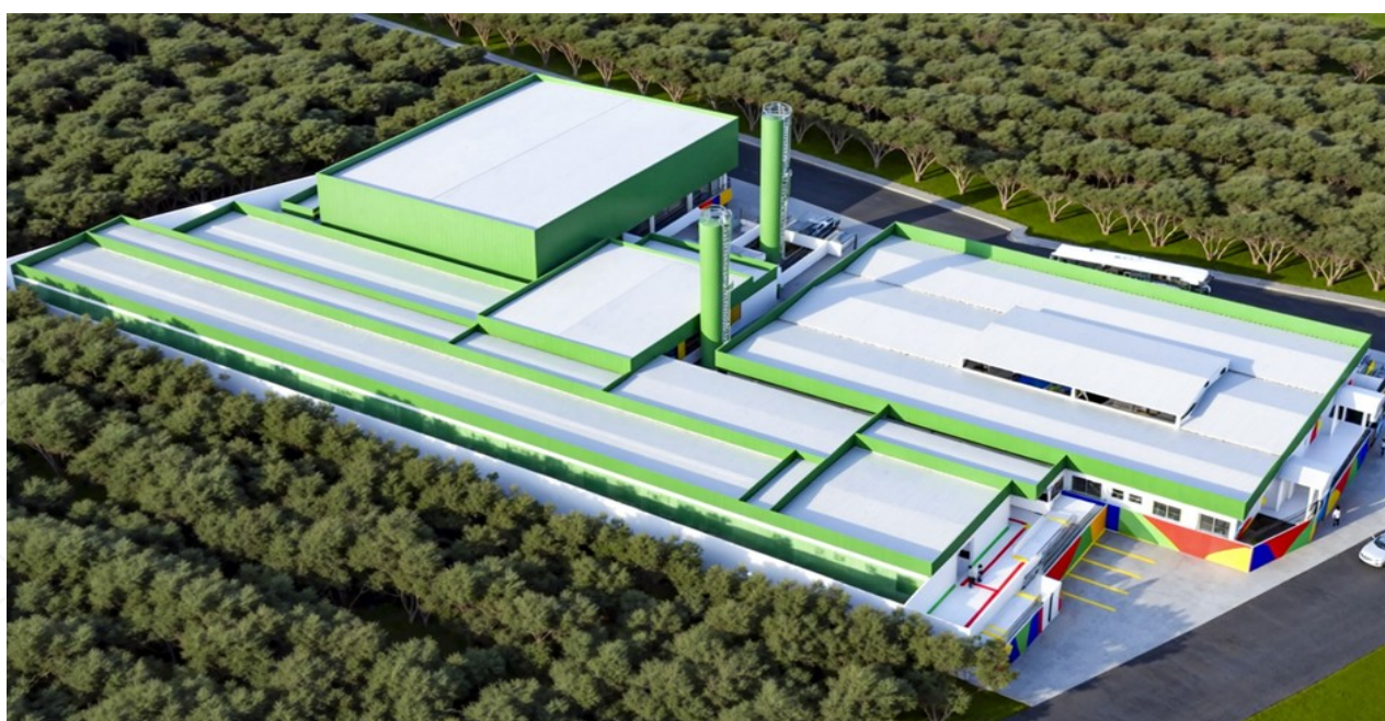
FIGURA 5 - Perspectiva