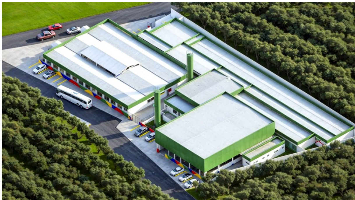
FIGURA 3 – Perspectiva