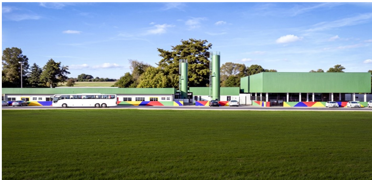
FIGURA 2 – Perspectiva