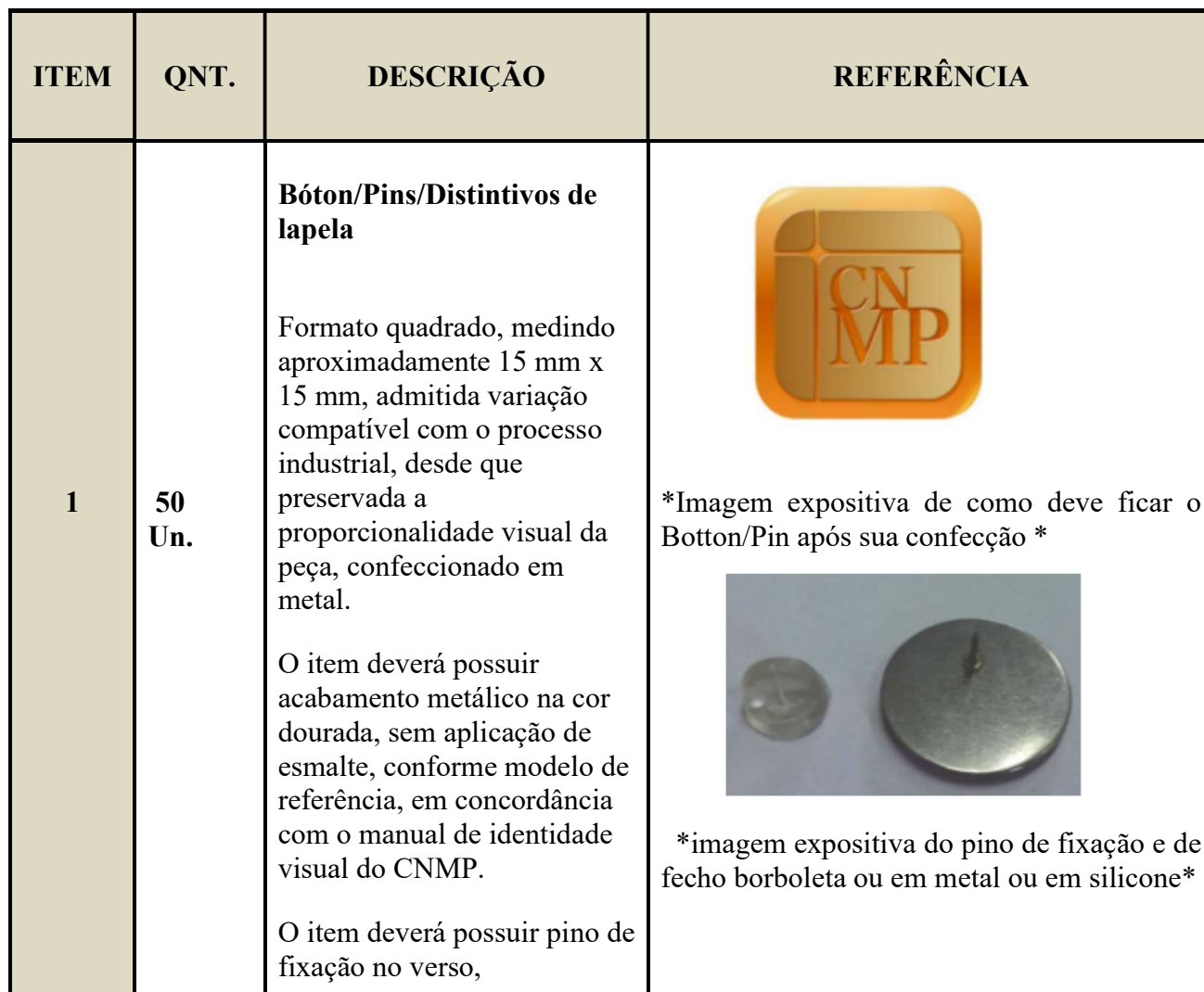
Tabela detalhada de descrição dos Objetos