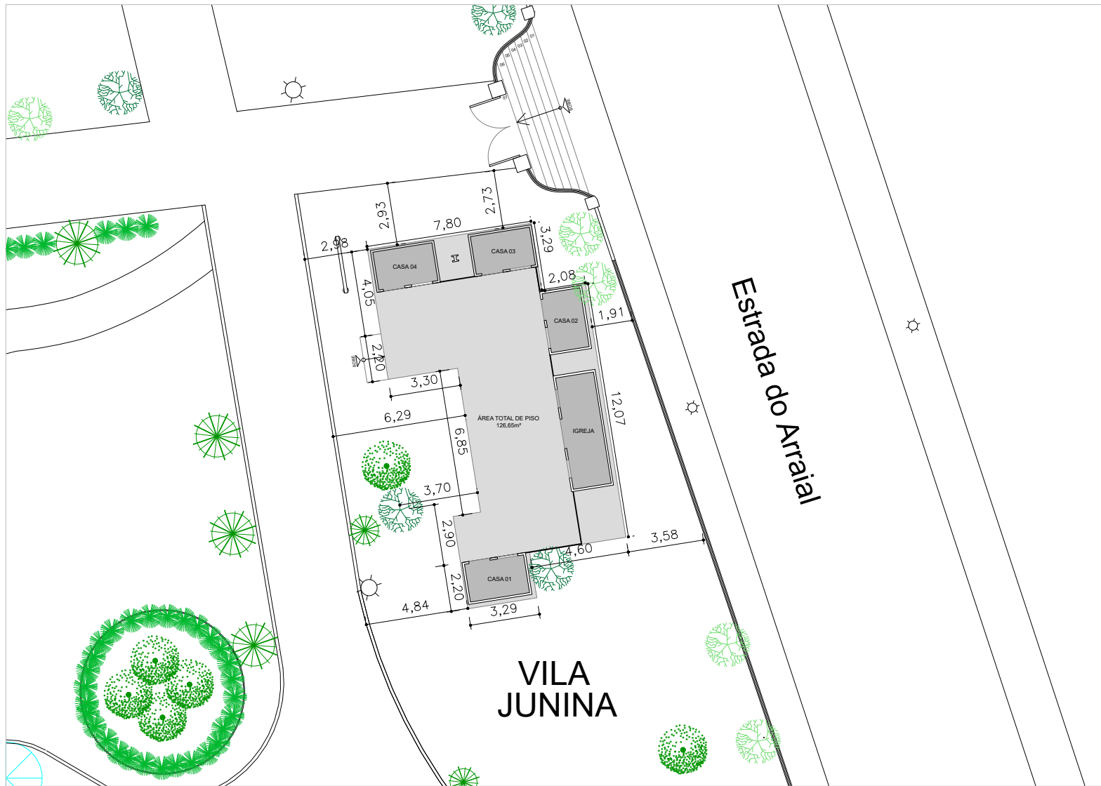
1 PLANTA DE LOCAÇÃO – VILA JUNINA – SÍTIO TRINDADE ESCALA – 1:250