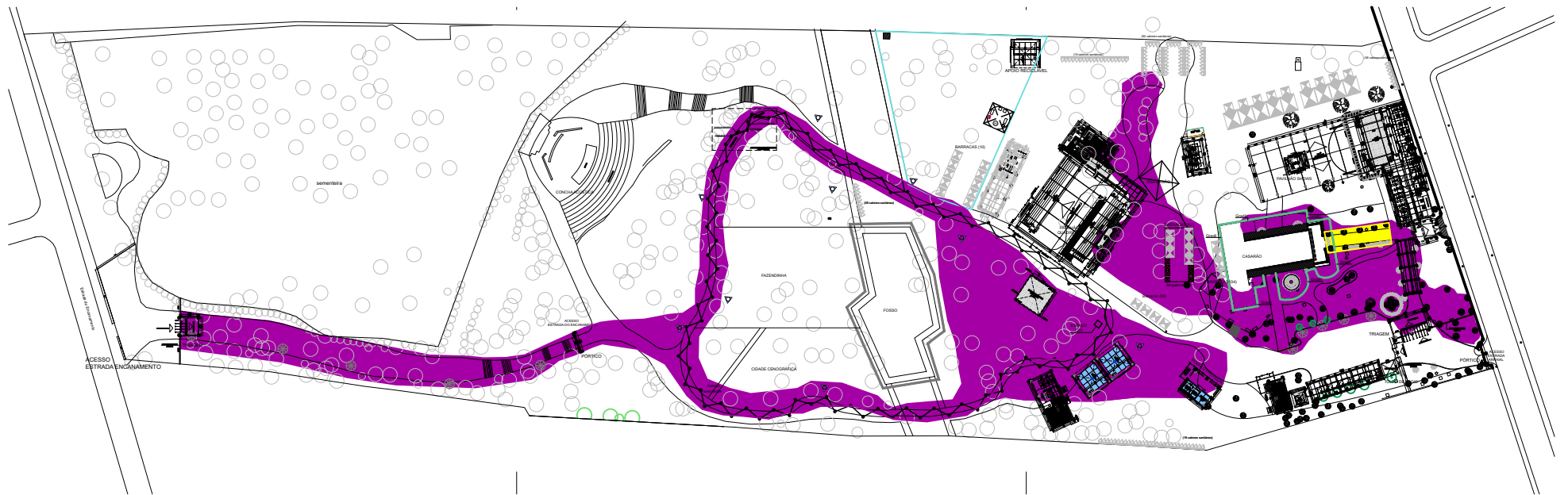
1 PLANTA DE LOCAÇÃO – SÍTIO TRINDADE – REFLETORES SEM ESCALA