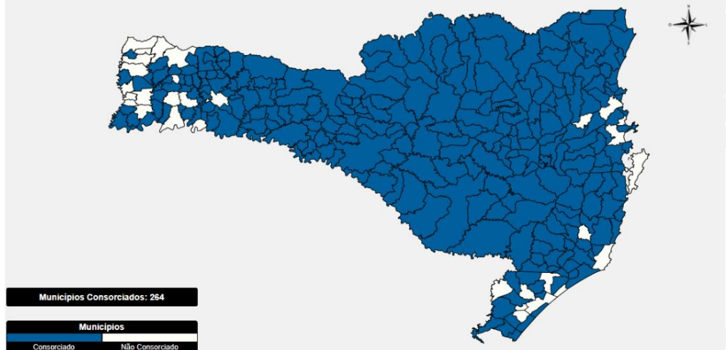
Figura 1: Distribuição dos municípios consorciados ao CINCATARINA

Os objetivos e finalidades dos CINCATARINA encontram-se dispostos no art. 2º de seu Protocolo de Intenções, quais sejam: