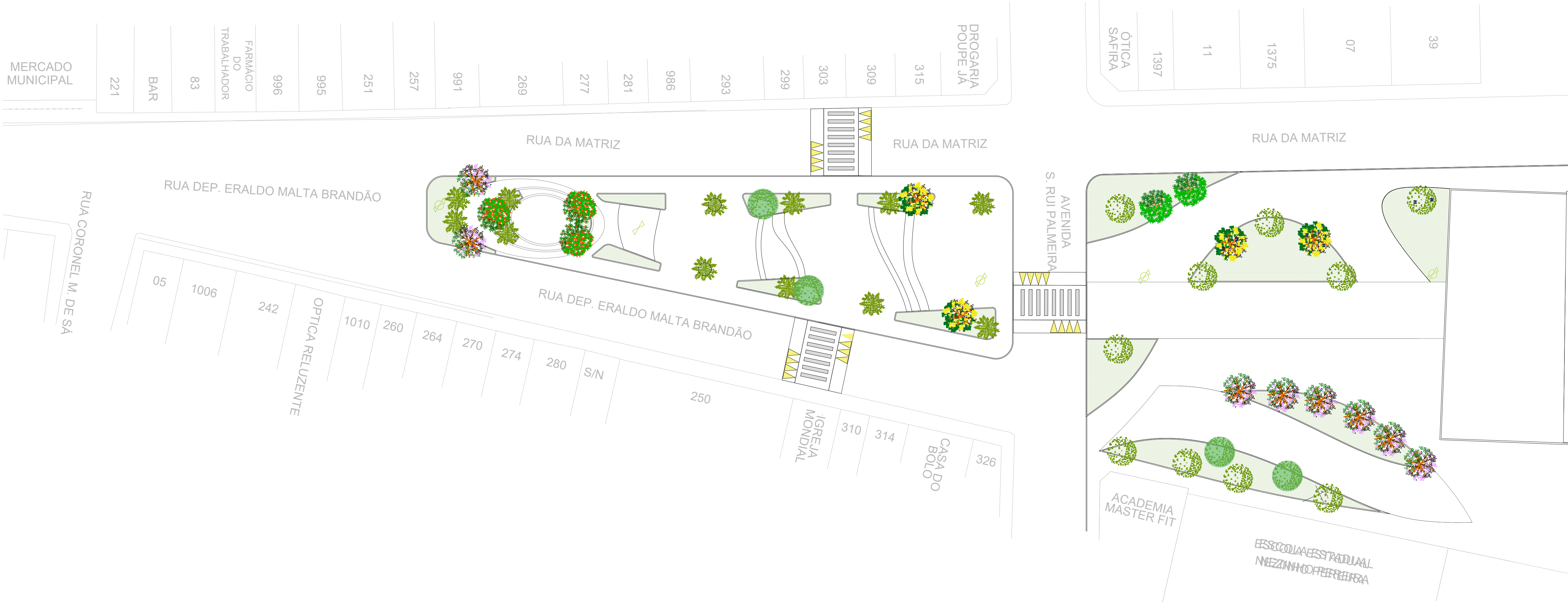
3 PLANTA BAIXA DE VEGETAÇÃO ESCALA 1/250