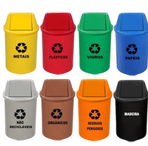
Figura 5. Código de cores de resíduos conforme a CONAMA 275/01.

informativas para a coleta seletiva, conforme Tabela 4. Além disso a placa deve conter a identificação do resíduo.