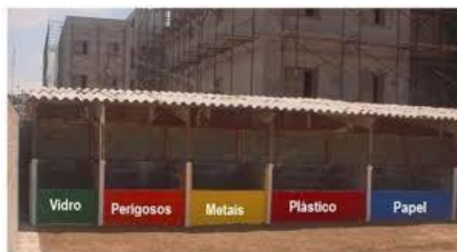
Figura 7. Baias para descarte de resíduos.

Baia: Estrutura de acondicionamento confeccionada em chapas ou placas de madeira, metal ou tela, dimensionada de forma compatível com o volume e o tipo de resíduo a ser armazenado. Em determinadas situações, a baia pode ser composta apenas por placas laterais delimitadoras; em outros casos, faz-se necessária a construção de um compartimento do tipo “caixa sem tampa”, garantindo maior controle e organização dos resíduos.