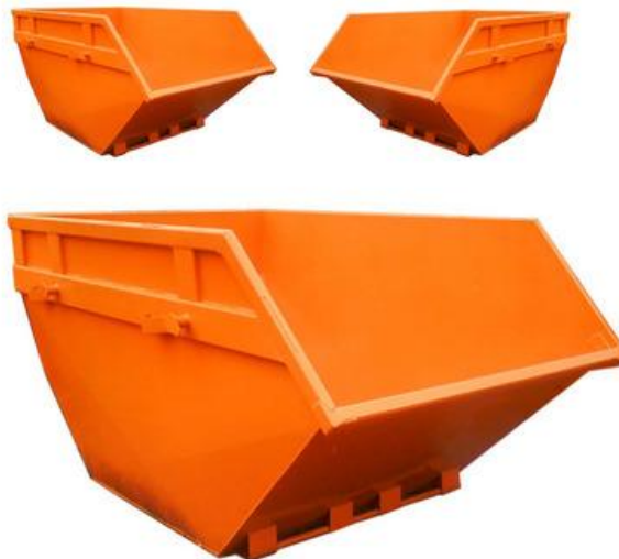
Figura 9. Caçamba estacionaria.

Caçamba estacionaria (caixa coletora): Recipiente metálico confeccionado em conformidade com as normas da ABNT, composto por chapas metálicas reforçadas e com capacidade de armazenamento da ordem de 5,0 m 3 , destinado à coleta, ao armazenamento temporário e ao transporte dos resíduos da construção civil.