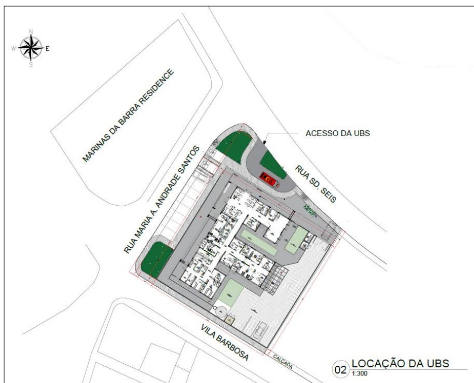
Figura 3. Planta de Localização (UBS).