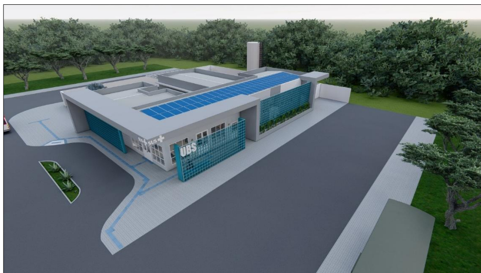
Figura 1. Ilustração da Unidade Básica de Saúde (UBS) após a execução do projeto.

O prazo total previsto para a execução do empreendimento é de 10 (dez) meses . Durante todo o período de obra, as atividades serão planejadas e executadas de forma integrada, garantindo a correta segregação, acondicionamento, transporte e destinação ambientalmente adequada dos resíduos da construção civil gerados, em conformidade com a legislação vigente e com as diretrizes estabelecidas neste Plano de Gerenciamento de Resíduos da Construção Civil (PGRCC).