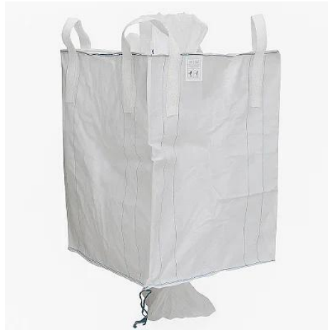
Figura 8. Bags para descarte dos resíduos.