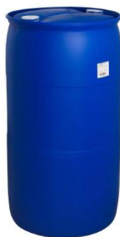
Figura 6. Bombona plástica.

Bombona: Recipiente com capacidade aproximada de 50 litros, apresentando diâmetro superior a 35 cm após o corte da parte superior. As bombonas deverão ser revestidas internamente com sacos de rafia e devidamente identificadas por meio de nomenclatura e cores padronizadas da coleta seletiva, de acordo com o tipo de material a ser acondicionado.