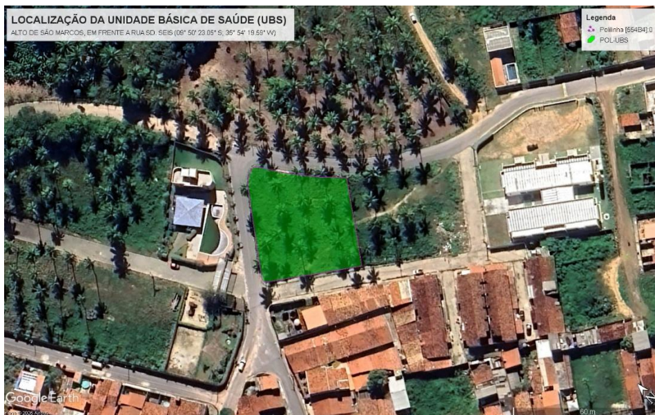
Figura 2. Planta de Localização (UBS).